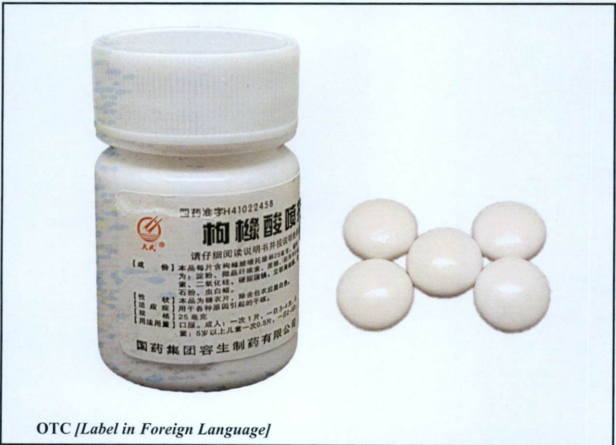
OTC [Label in Foreign Language]