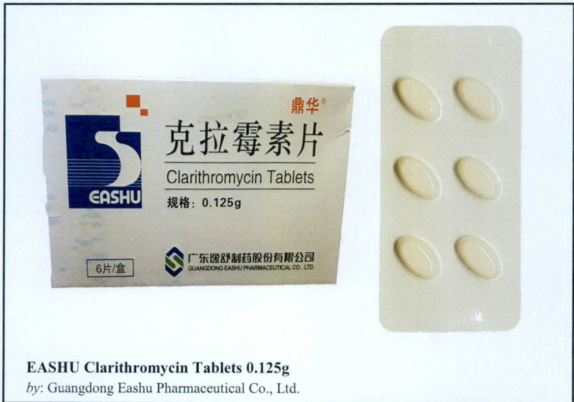
EASHU Clarithromycin Tablets 0.125g

by: Guangdong Eashu Pharmaceutical Co., Ltd.