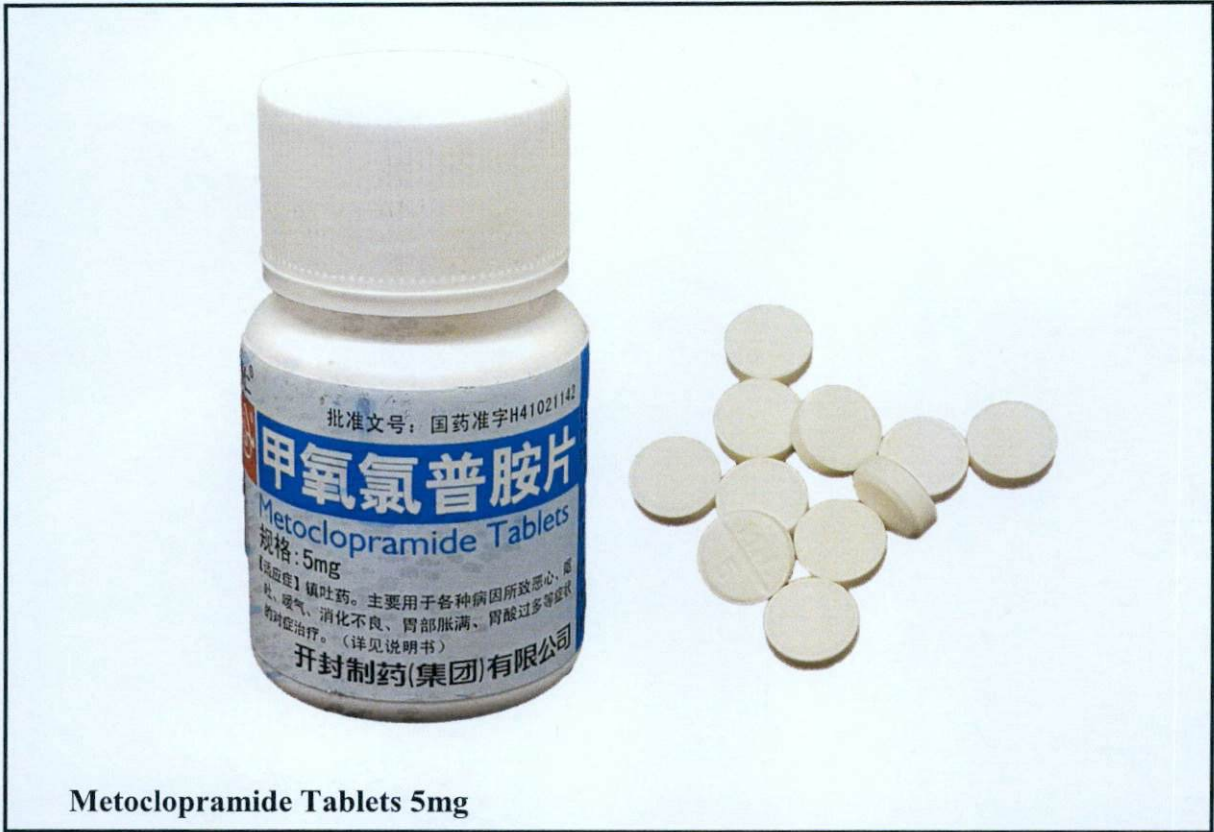
Metoclopramide Tablets 5mg