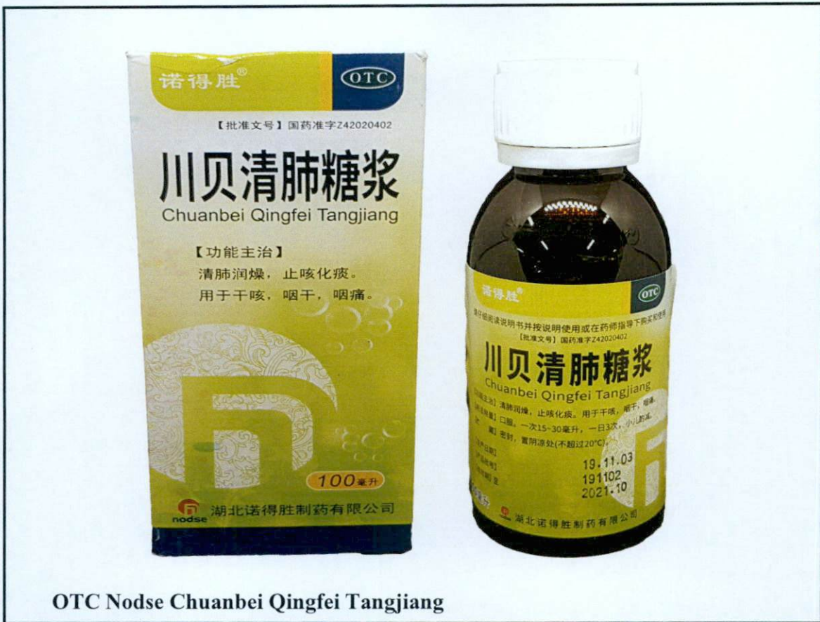
OTC Nodse Chuanbei Qingfei Tangjiang