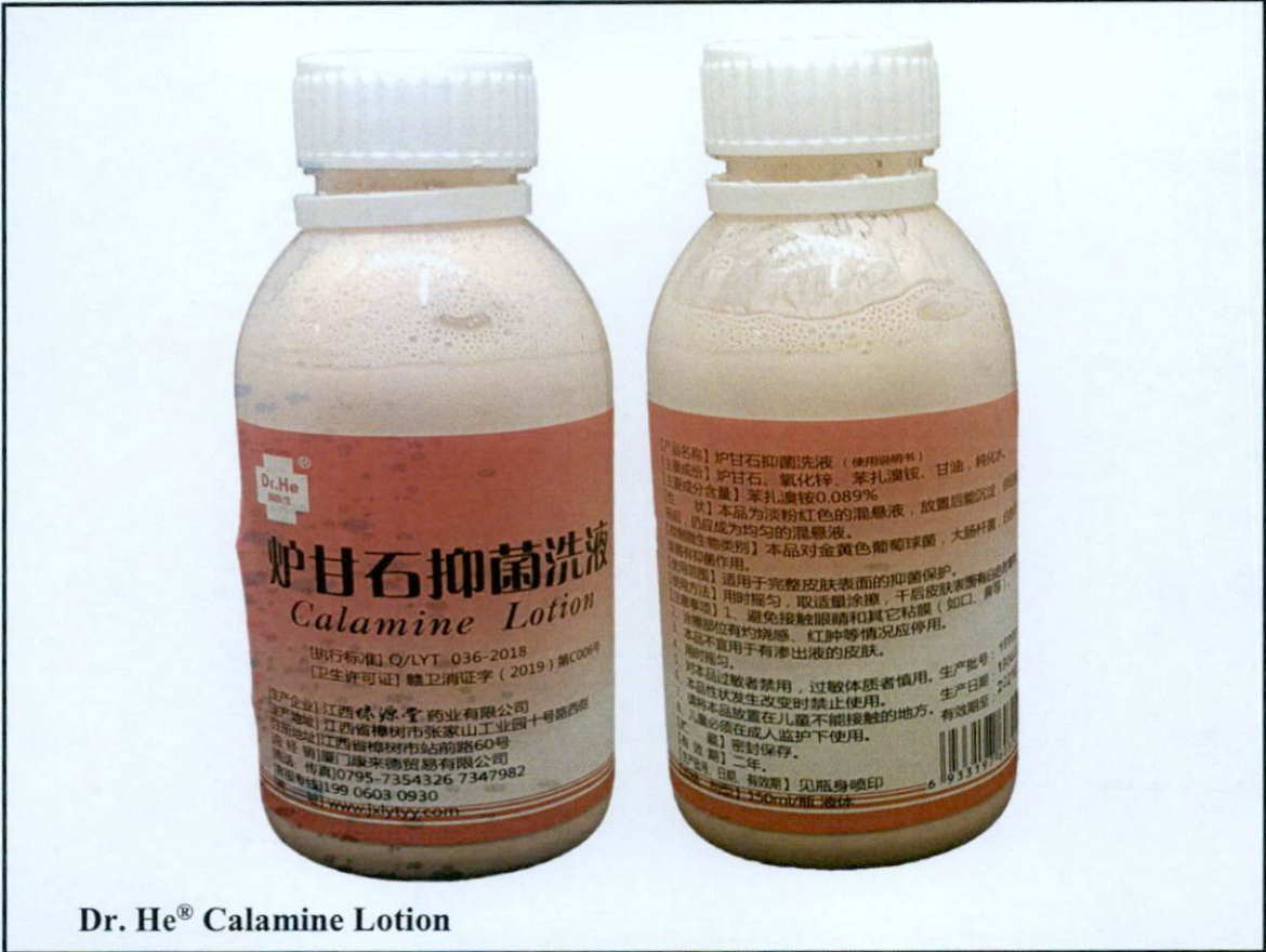
Dr. He® Calamine Lotion