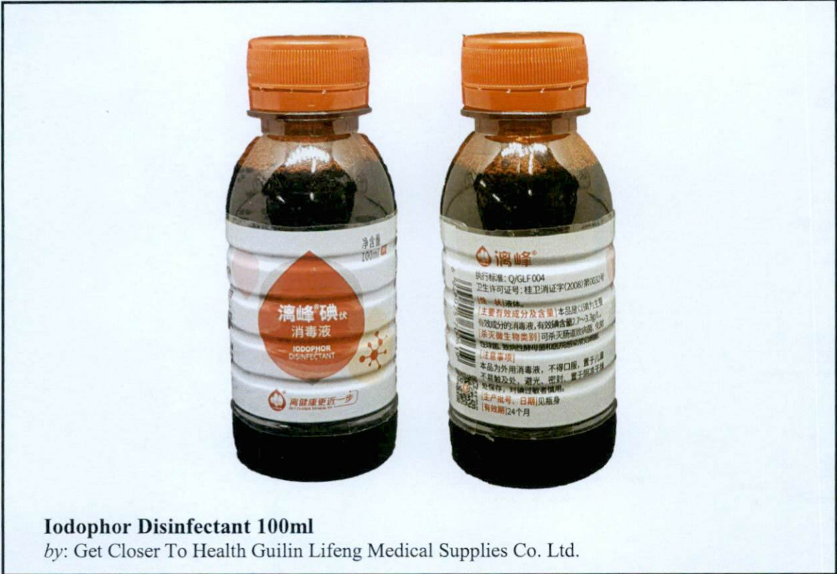
Iodophor Disinfectant 100ml by: Get Closer To Health Guilin Lifeng Medical Supplies Co. Ltd.