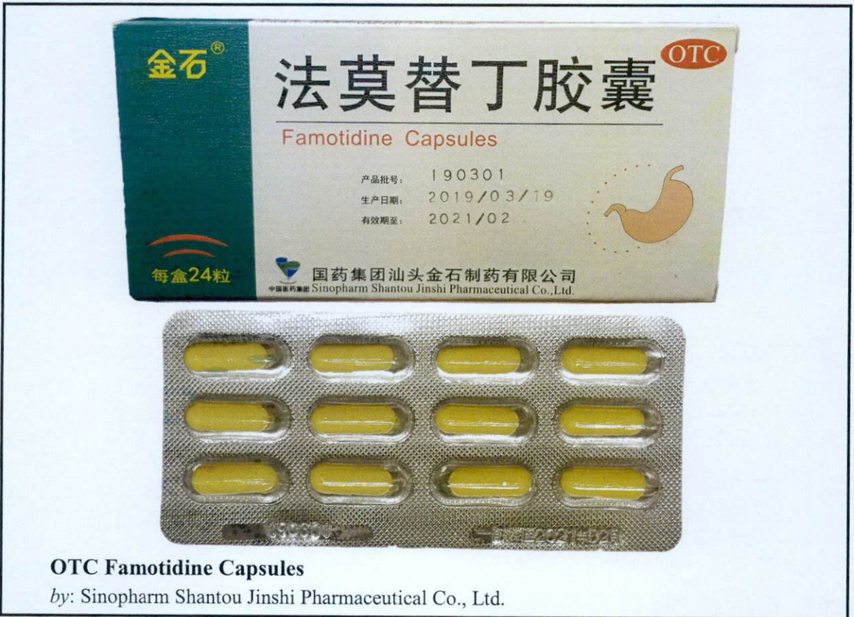
OTC Famotidine Capsules

by: Sinopharm Shantou Jinshi Pharmaceutical Co., Ltd.