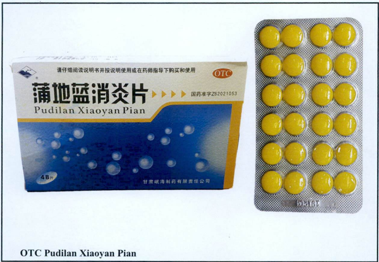
OTC Pudilan Xiaoyan Pian