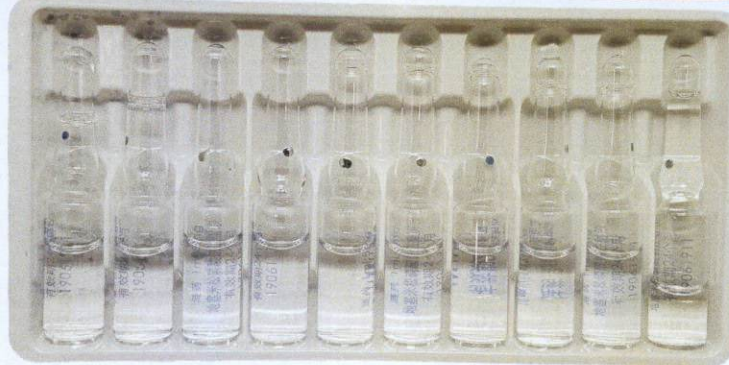
Lian Yao® Dexamethasone Sodium Phosphate Injection 1ml: 5mg by: Jiang Su Lian Shui Pharmaceutical Co., Ltd