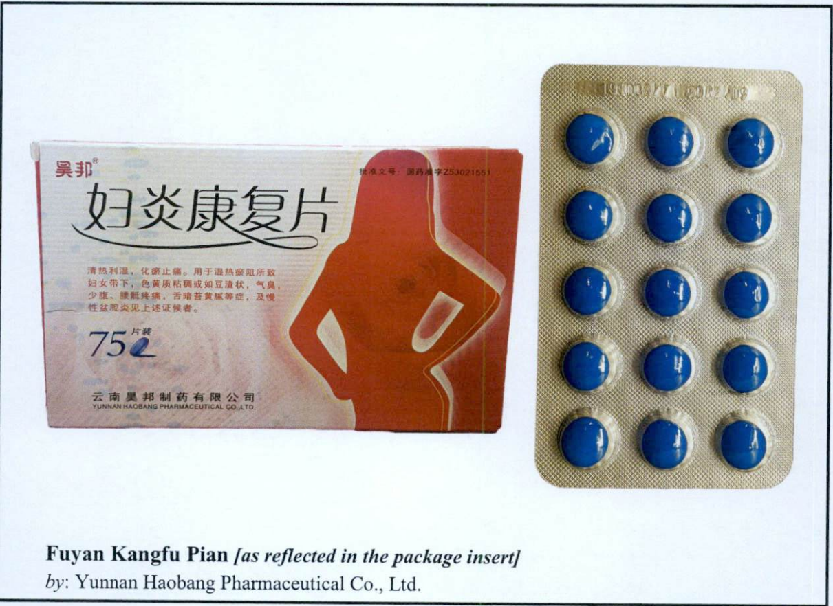
Fuyan Kangfu Pian [as reflected in the package insert] by: Yunnan Haobang Pharmaceutical Co., Ltd.