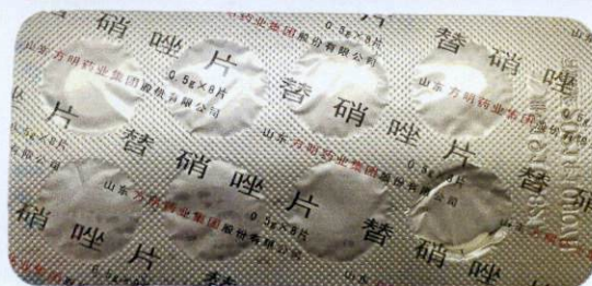
Dongyao® Tinidazole Tablets 0.5g by: Shandong Fangming Pharmaceutical Group Co., Ltd.