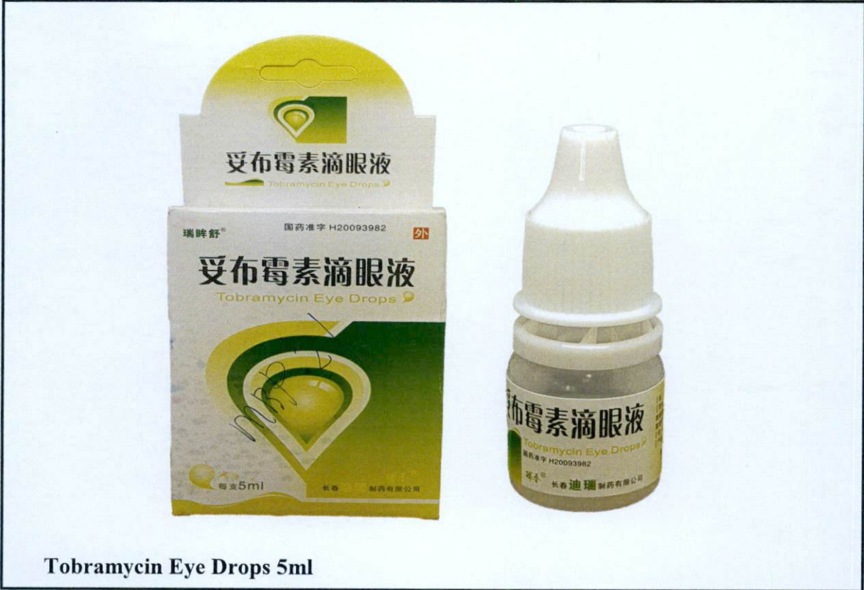
Tobramycin Eye Drops 5ml