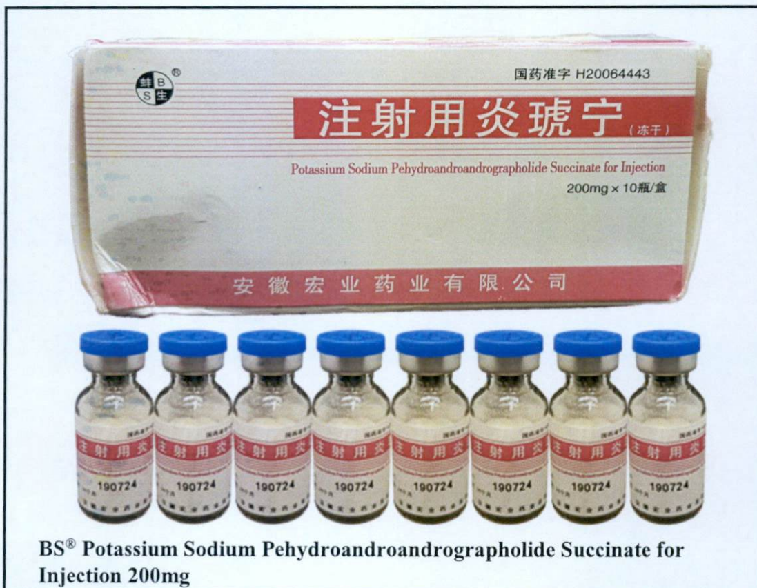
BS ® Potassium Sodium Pehydroandroandrographolide Succinate for Injection 200mg

Pinapayuhan ng Food and Drug Administration (FDA) ang publiko laban sa pagbili at paggamit ng mga hindi rehistradong gamot na: