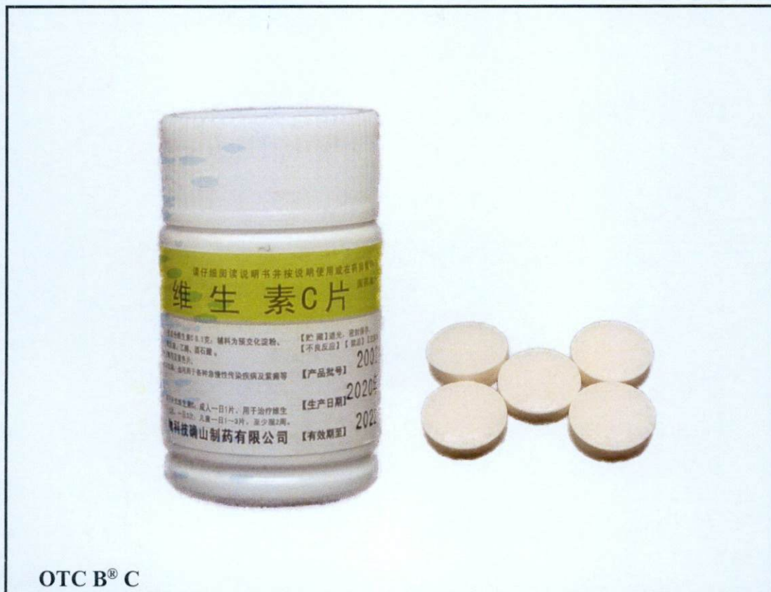
OTC B ® C

Pinapayuhan ng Food and Drug Administration (FDA) ang publiko laban sa pagbili at paggamit ng mga hindi rehistradong gamot na: