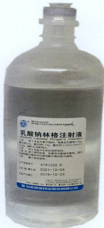
HUAN QIU® Sodium Lactate Ringer's Injection