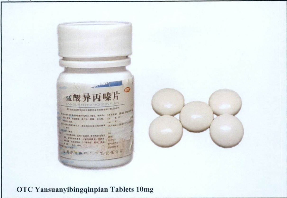
OTC Yansuanyibingqin pian Tablets 10mg