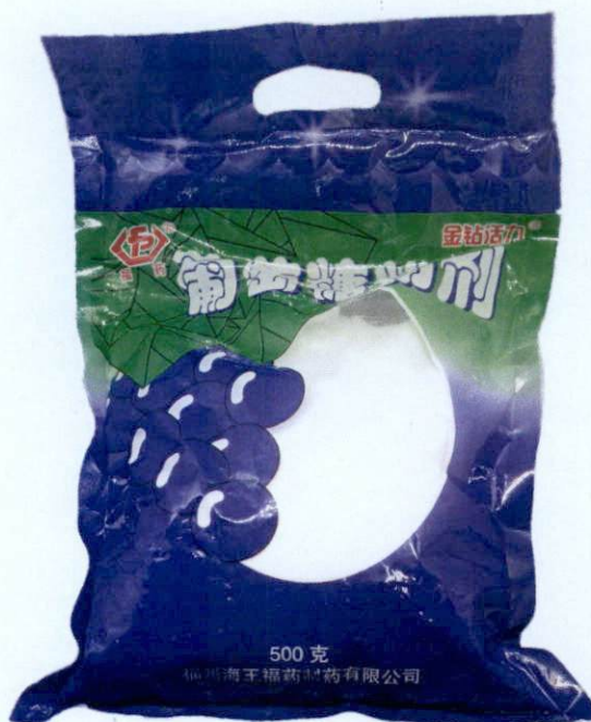
Fp® Glucose Powder