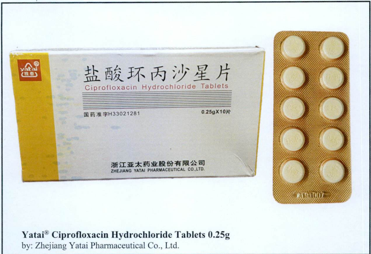
Yatai® Ciprofloxacin Hydrochloride Tablets 0.25g by: Zhejiang Yatai Pharmaceutical Co., Ltd.