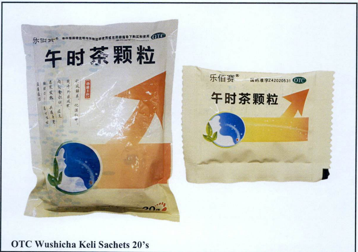
Larawan 5. Hindi rehistradong gamot