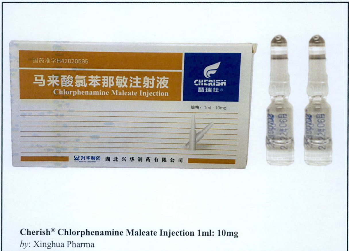
Cherish® Chlorphenamine Maleate Injection 1ml: 10mg by: Xinghua Pharma