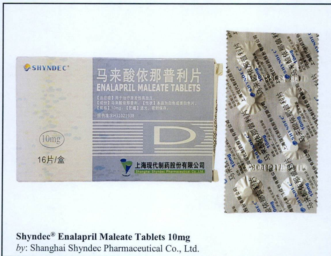
Shyndec® Enalapril Maleate Tablets 10mg by: Shanghai Shyndec Pharmaceutical Co., Ltd.

Pinapayuhan ng Food and Drug Administration (FDA) ang publiko laban sa pagbili at paggamit ng mga hindi rehistradong gamot na: