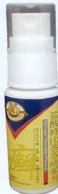
OTC South Ocean Yansuan Tebinaifen Penwuji