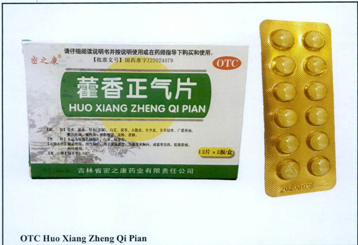
OTC Huo Xiang Zheng Qi Pian