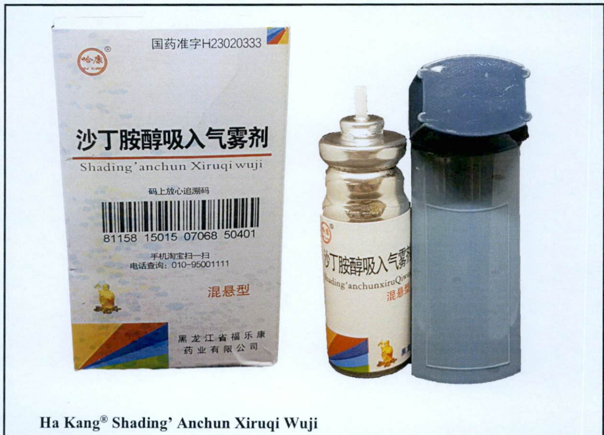
Ha Kang® Shading' Anchun Xiruqi Wuji