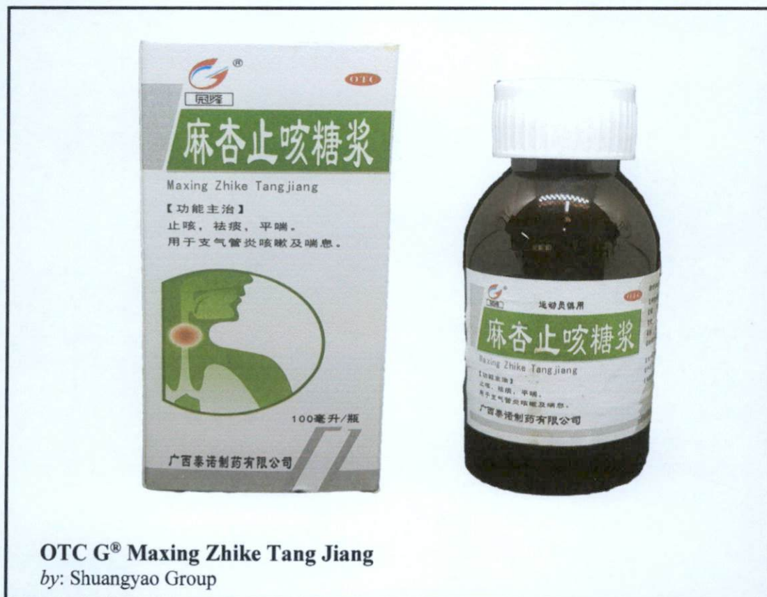
Larawan 1. Hindi rehistradong gamot

Pinapayuhan ng Food and Drug Administration (FDA) ang publiko laban sa pagbili at paggamit ng mga hindi rehistradong gamot na: