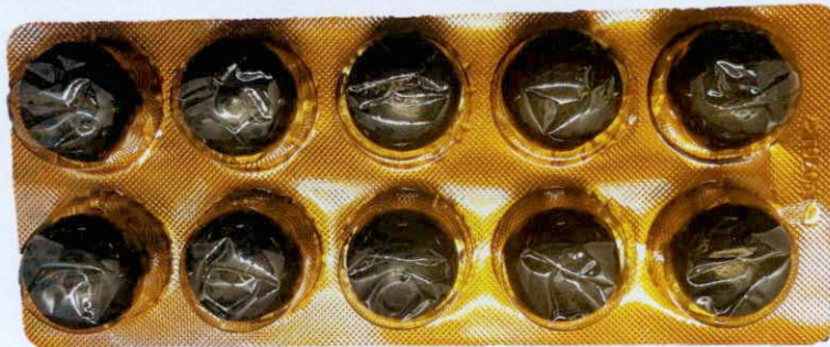
Song Xia ® An Tai Wan 6g