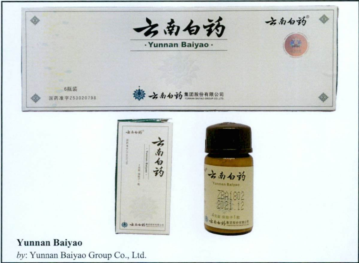
Larawan 4. Hindi rehistradong gamot