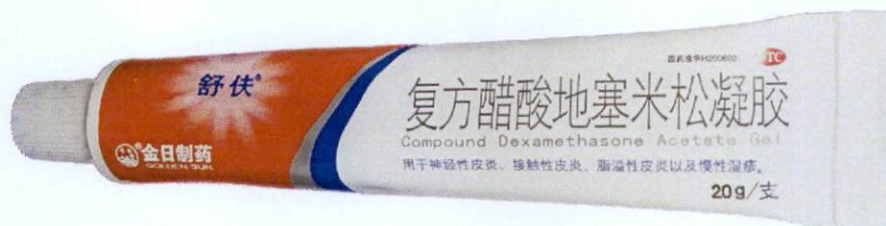
OTC Compound Dexamethasone Acetate Gel by: Golden Sun