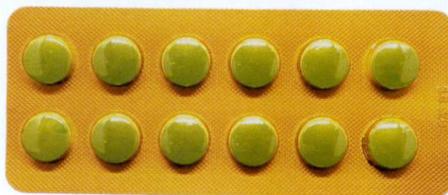
OTC Qing Huo Pian by: Huluwa Pharmaceutical Group