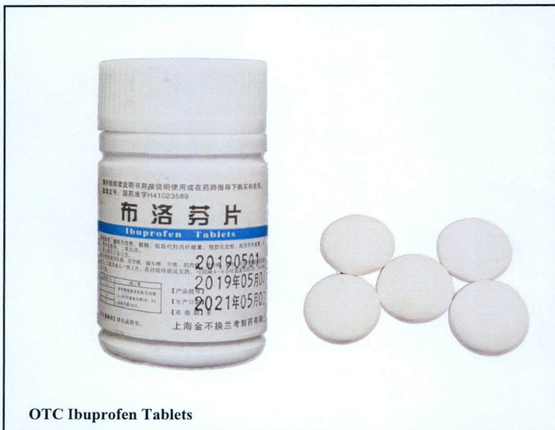
OTC Ibuprofen Tablets

Pinapayuhan ng Food and Drug Administration (FDA) ang publiko laban sa pagbili at paggamit ng mga sumusunod na hindi rehistradong gamot: