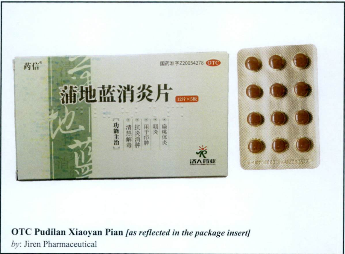
Larawan 5. Hindi rehistradong gamot