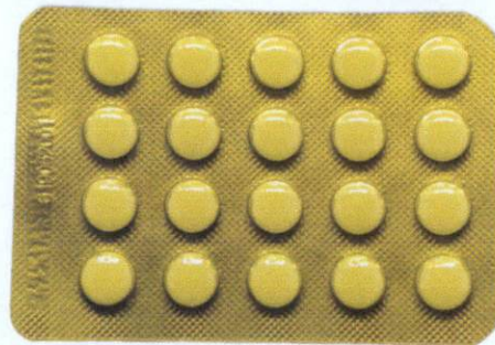
OTC Ambroxol Hydrochloride Tablets Yansuan Anxiusuo Pian [as reflected in the package insert]