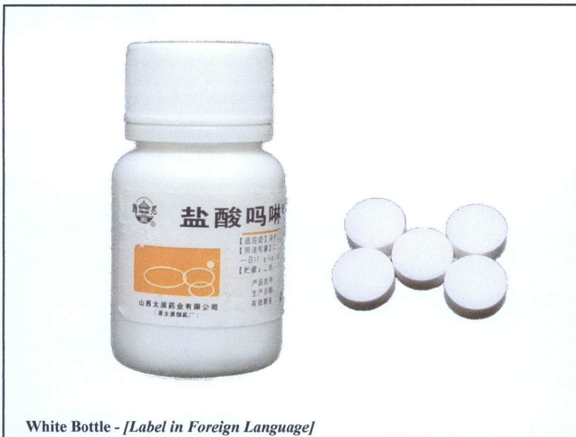
White Bottle - [Label in Foreign Language]