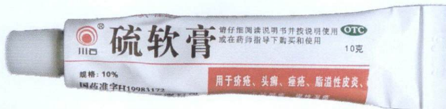
OTC Sulfur Ointment – Liu Ruangao [as reflected in the package insert]