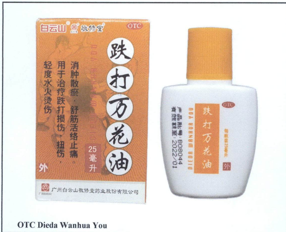
OTC Dieda Wanhua You

Pinapayuhan ng Food and Drug Administration (FDA) ang publiko laban sa pagbili at paggamit ng mga hindi rehistradong gamot na: