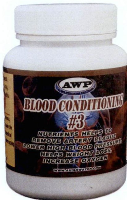
AWP Aviso Wellness Protocol Blood Conditioning #3

Trader: Aviso Wellness Protocol International Incorporated - Tumana Kaularan Village Navotas City, Philippines