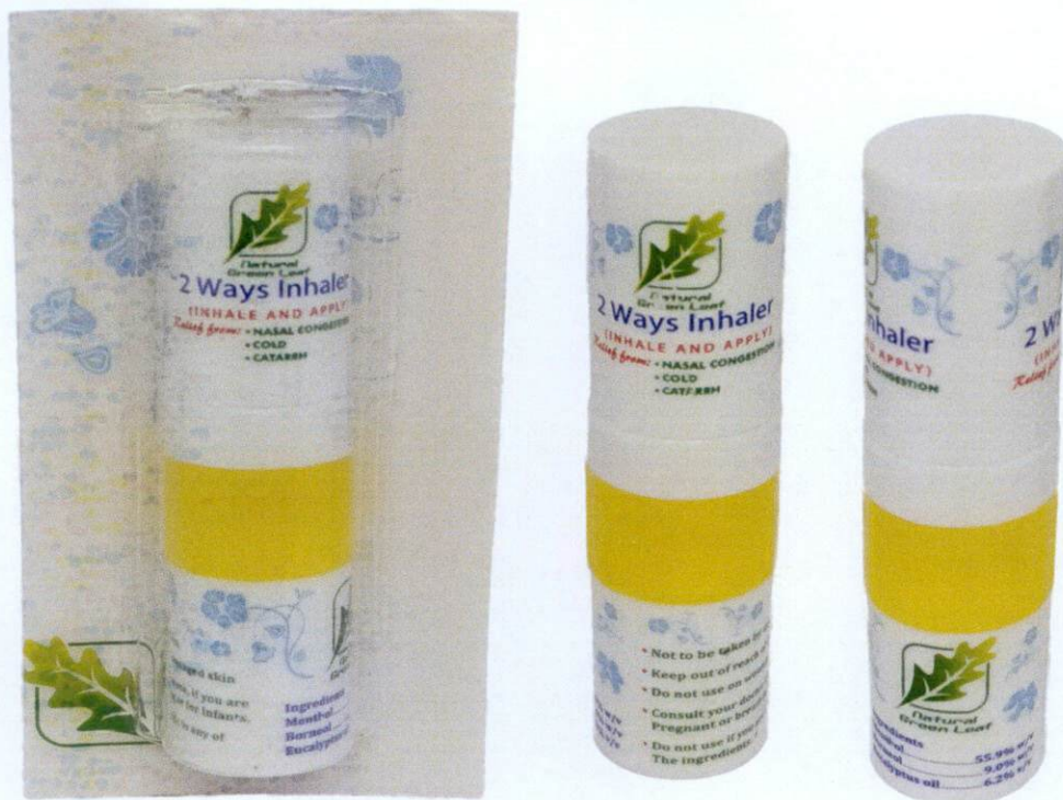
Natural Green Leaf 2 Ways Inhaler ( Inhale And Apply )