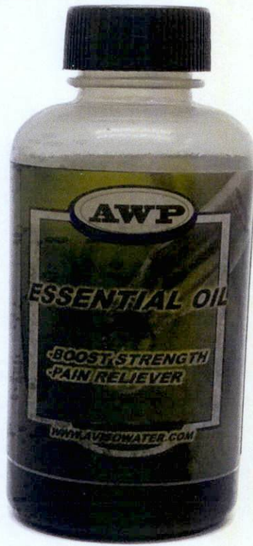
AWP Aviso Wellness Protocol Essential Oil