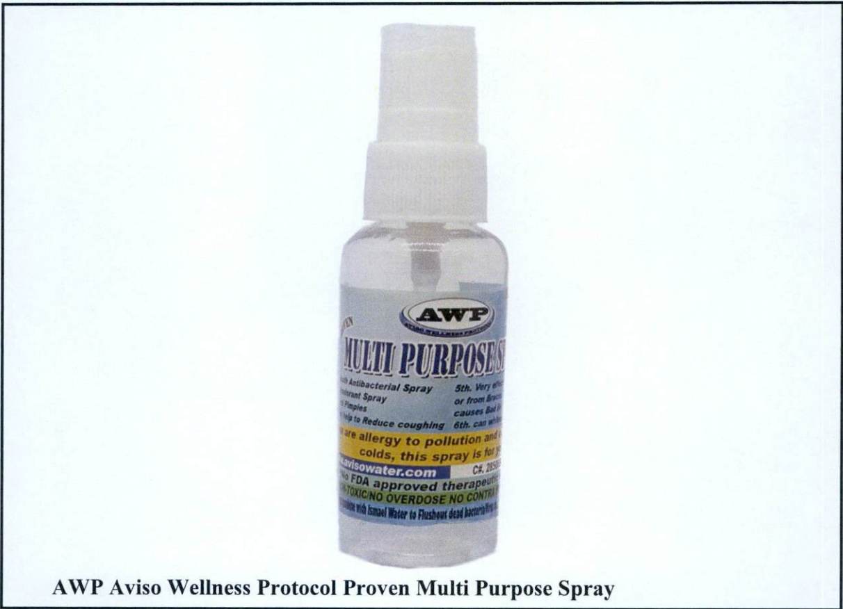
AWP Aviso Wellness Protocol Proven Multi Purpose Spray