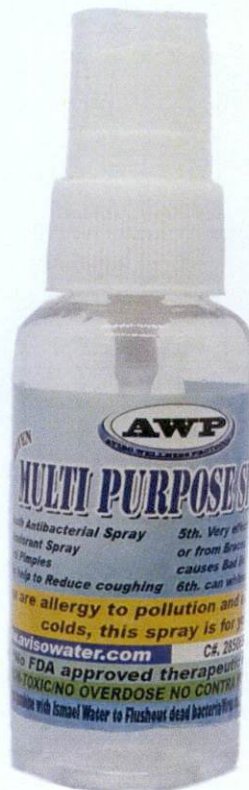
AWP Aviso Wellness Protocol Proven Multi Purpose Spray