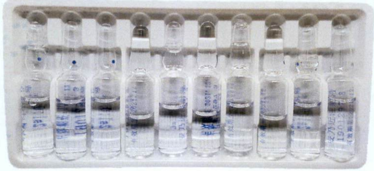
Metamizole Sodium Injection 2ml: 0.5g by: Xinxiangshi Chang Le Pharmaceutical Co., Ltd.