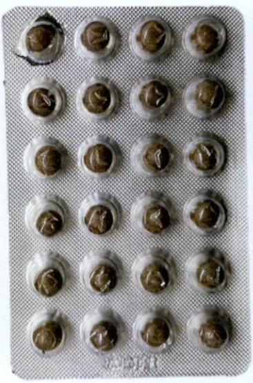
Liuganwan by: Qinghaisheng Geladandong Yaoye Youxian Gongsi