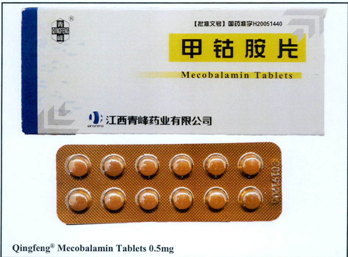
Qingfeng® Mecobalamin Tablets 0.5mg