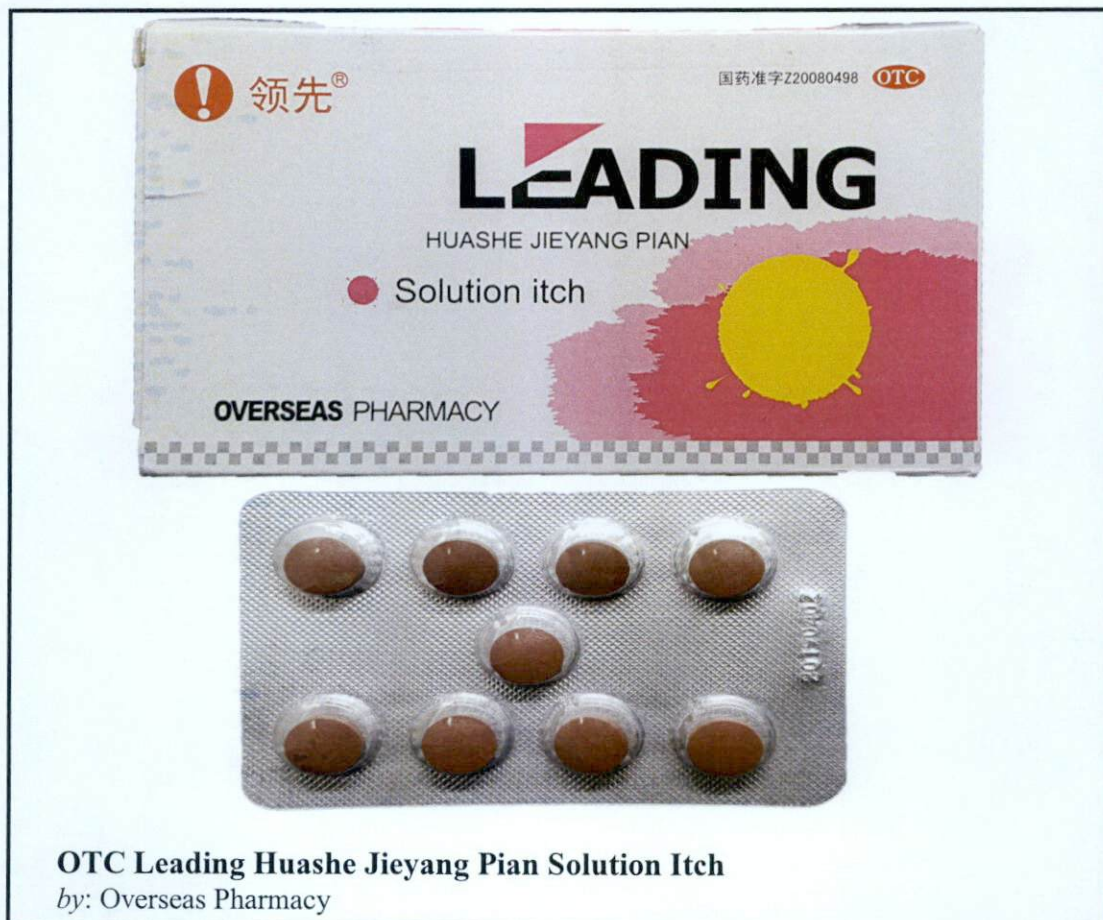
OTC Leading Huashe Jieyang Pian Solution Itch by: Overseas Pharmacy

Pinapayuhan ng Food and Drug Administration (FDA) ang publiko laban sa pagbili at paggamit ng mga sumusunod na hindi rehistradong gamot: