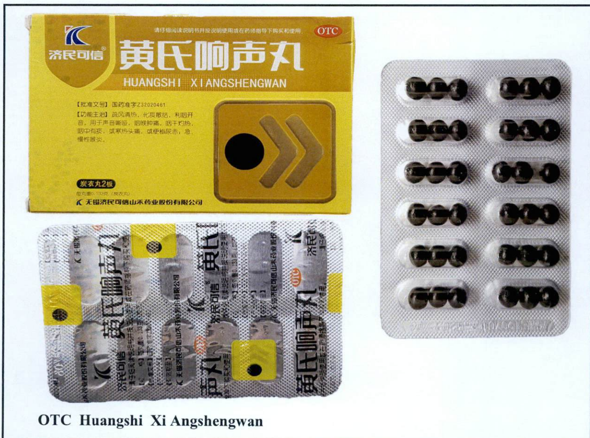
OTC Huangshi Xi Angshengwan