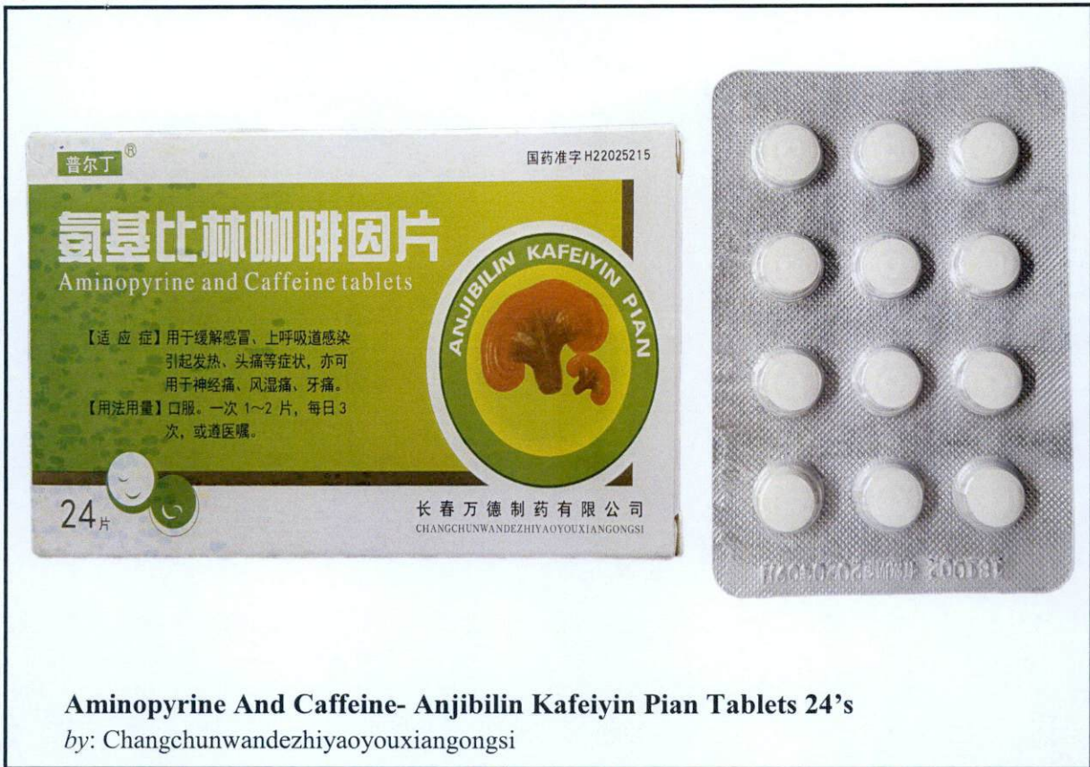
Aminopyrine And Caffeine- Anjibilin Kafeiyin Pian Tablets 24's by: Changchunwandezhiyaoyouxiangongsi