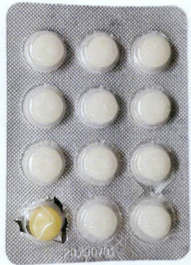
Phenoxymethylpenicillin Potassium Tablets 12's by: Jilin Province Bainian Liufutang Pharmaceutical Co., Ltd.