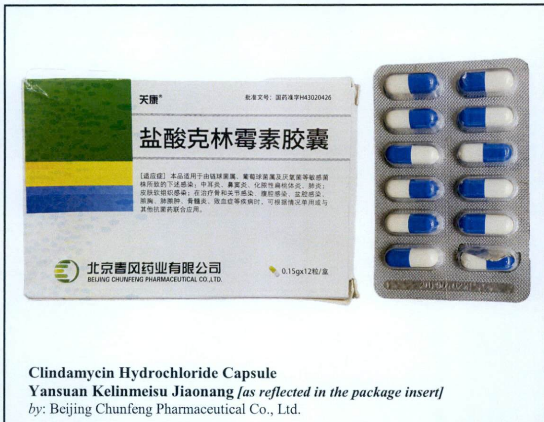
Clindamycin Hydrochloride Capsule Yansuan Kelinmeisu Jiaonang [as reflected in the package insert] by: Beijing Chunfeng Pharmaceutical Co., Ltd.

Pinapayuhan ng Food and Drug Administration (FDA) ang publiko laban sa pagbili at paggamit ng mga sumusunod na hindi rehistradong gamot: