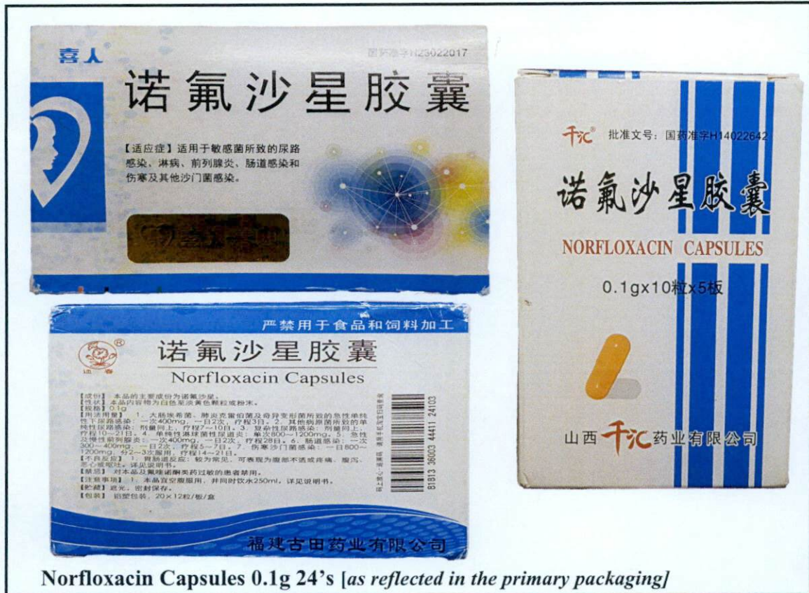
Norfloxacin Capsules 0.1g 24's [as reflected in the primary packaging]