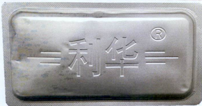
Phenoxymethylpenicillin Potassium Tablets 24's