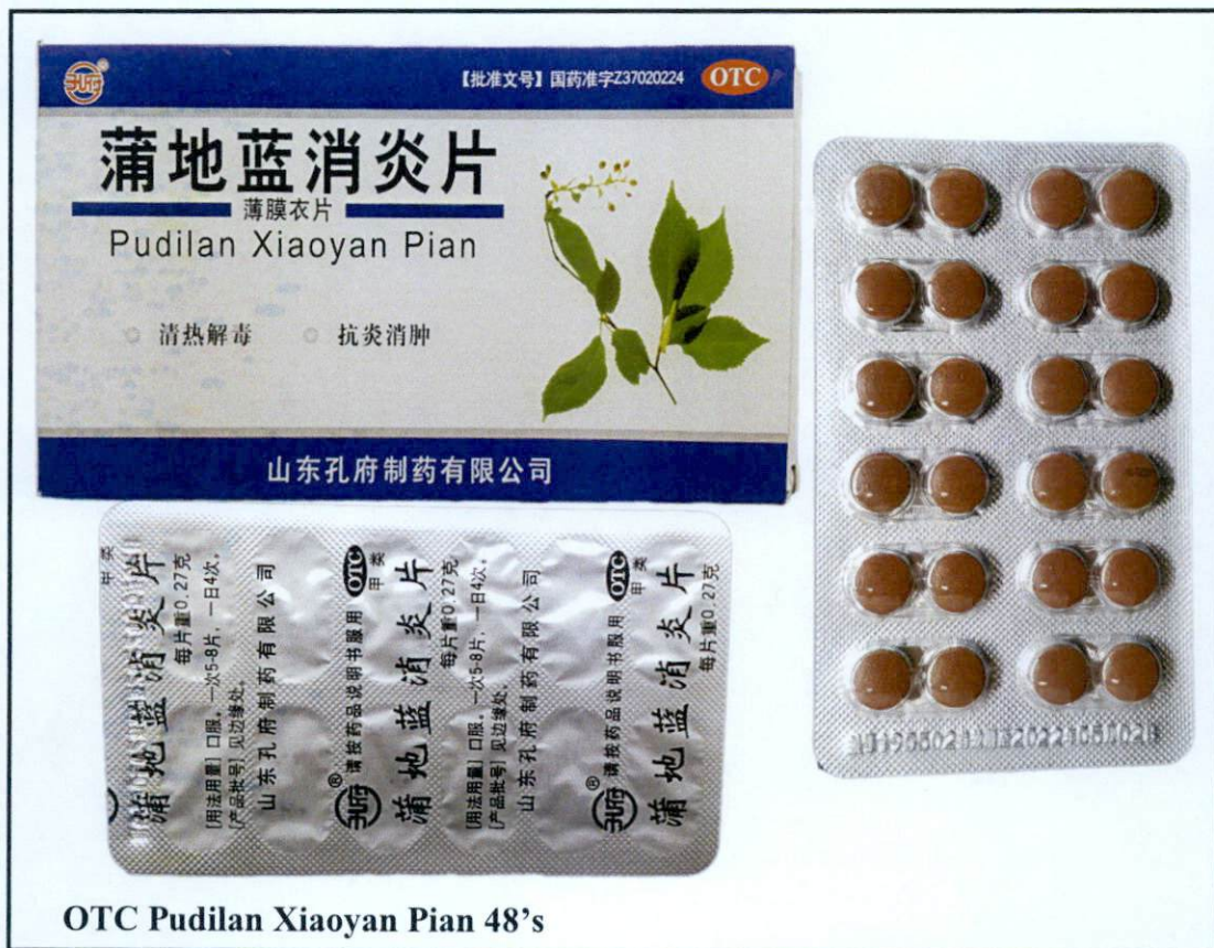
OTC Pudilan Xiaoyan Pian 48's

Pinapayuhan ng Food and Drug Administration (FDA) ang publiko laban sa pagbili at paggamit ng mga sumusunod na hindi rehistradong gamot: