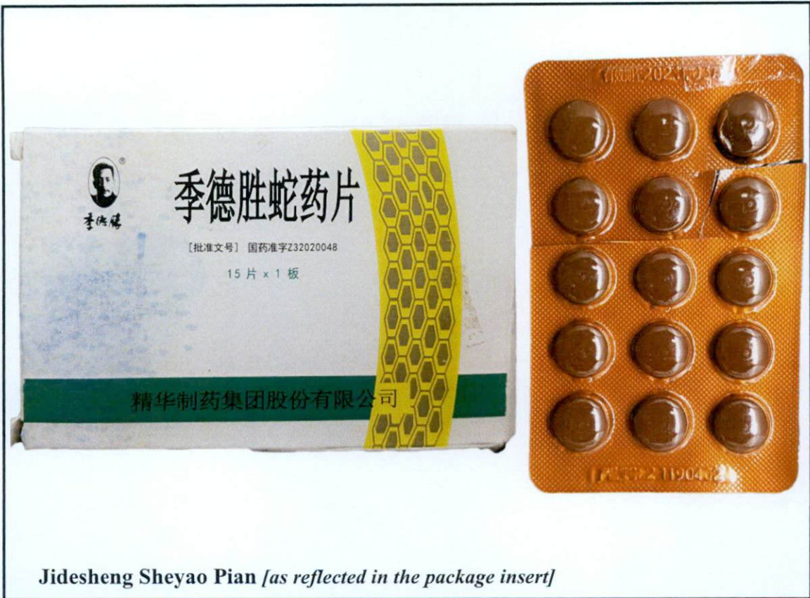
Jidesheng Sheyao Pian [as reflected in the package insert]