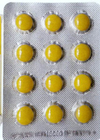
OTC Yanyan Pian [as reflected in the package insert] by: Chengdu Dikang Pharmaceutical Co., Ltd.