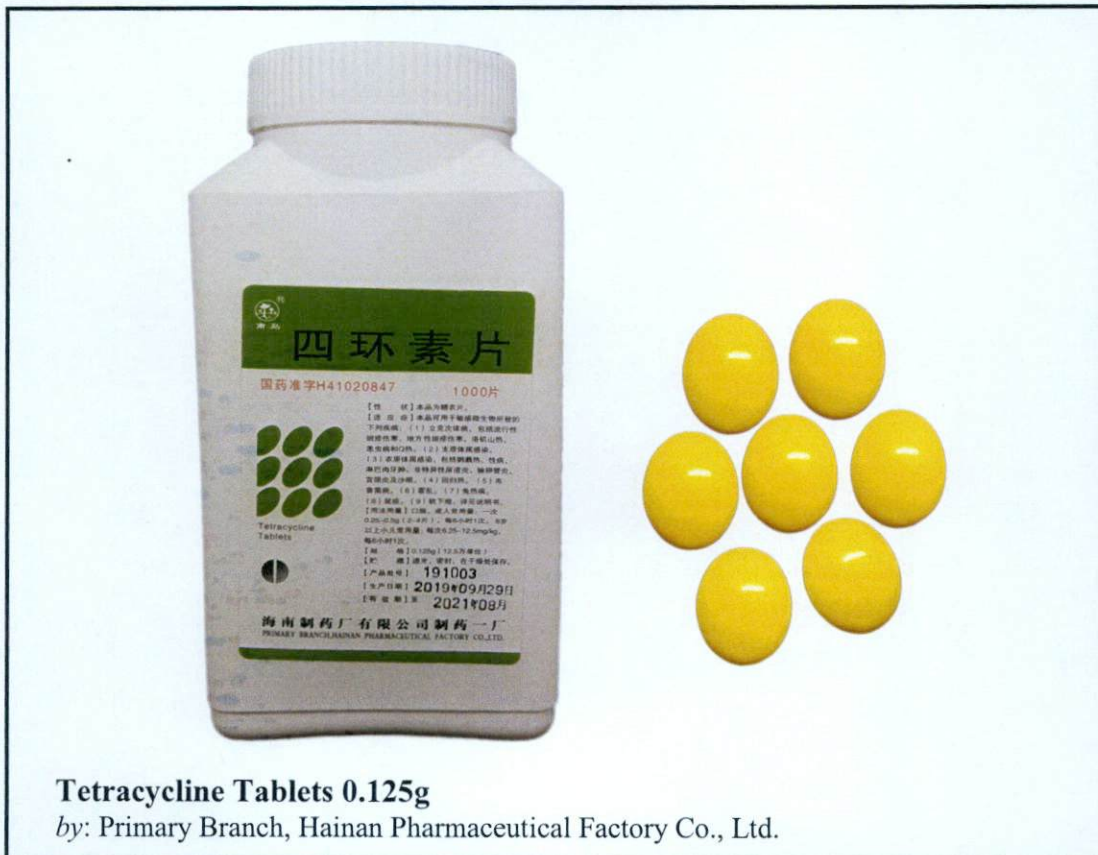
Larawan 1. Hindi rehistradong gamot

Pinapayuhan ng Food and Drug Administration (FDA) ang publiko laban sa pagbili at paggamit ng mga sumusunod na hindi rehistradong gamot: