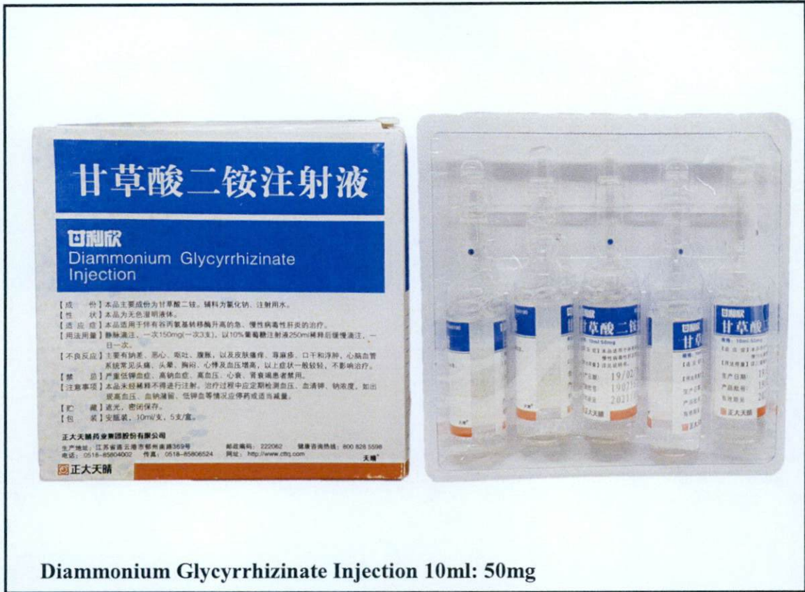
Diammonium Glycyrrhizate Injection 10ml: 50mg