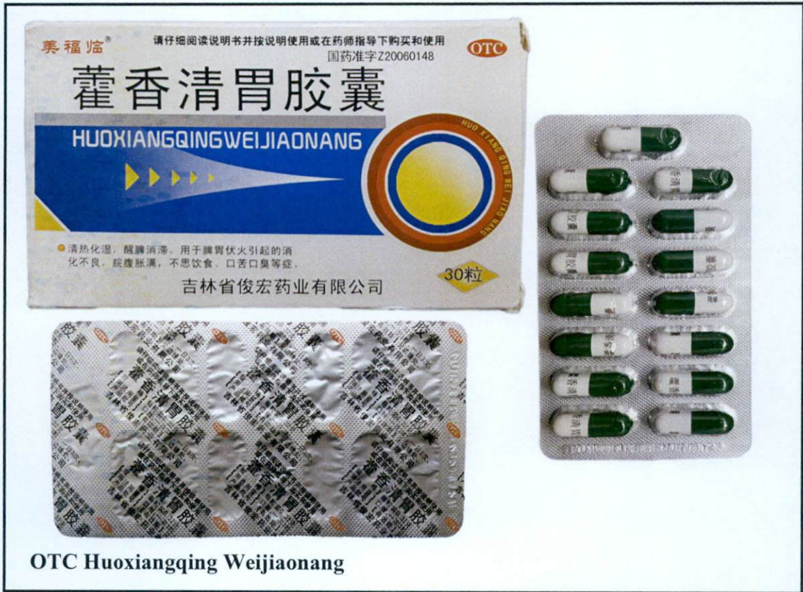
OTC Huoxiangqing Weijiaonang