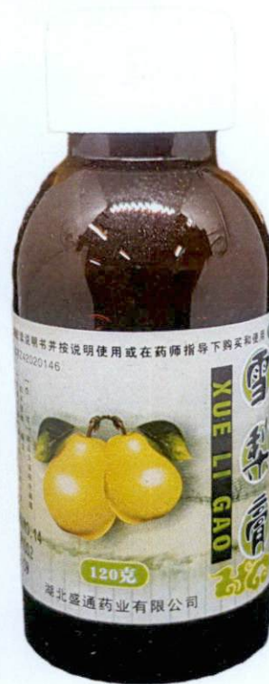
OTC Xue Li Gao