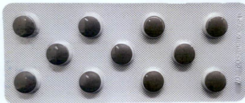
OTC Bai Xuan Xia Ta Re Pian 33's