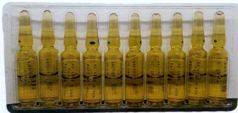
Ambroxol Hydrochloride Injection 2ml: 15mg