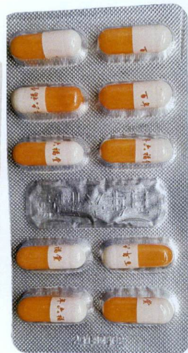
OTC Ibuprofen Sustained-Released Capsules