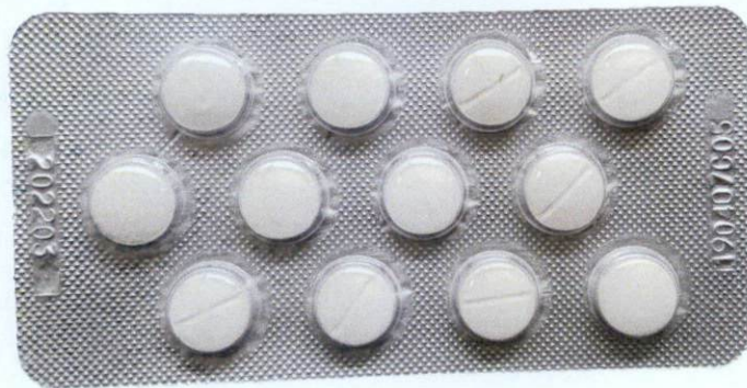
Doxofylline Tablets-Duosuo Chajian Pian 0.2g [as reflected in the package insert]