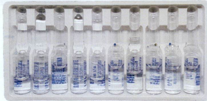
Dohongying Raccanisodamine Hydrochloride Injection 1ml: 10mg by: Jiangsu Dahongying Hengshun Pharmaceutical Co., Ltd.