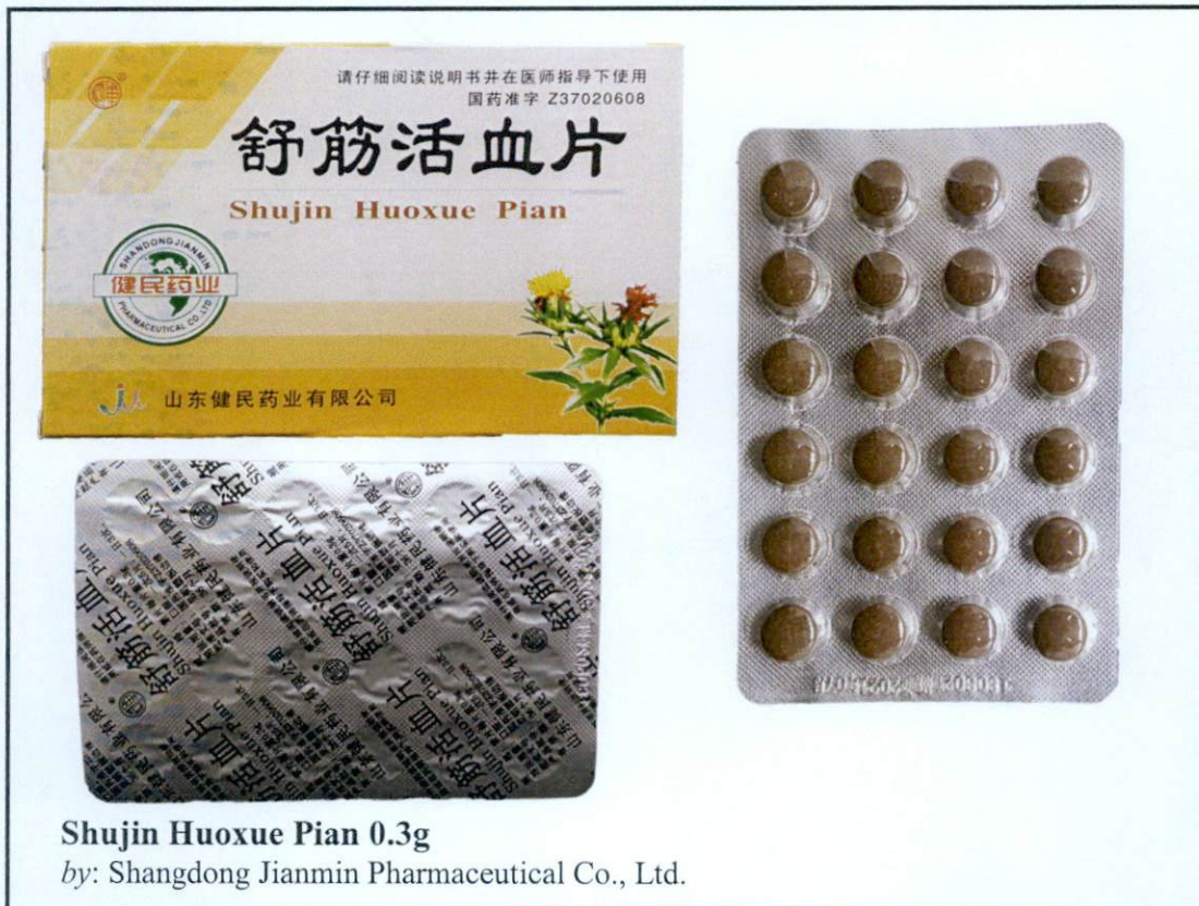
Shujin Huoxue Pian 0.3g by: Shangdong Jianmin Pharmaceutical Co., Ltd.

Pinapayuhan ng Food and Drug Administration (FDA) ang publiko laban sa pagbili at paggamit ng mga sumusunod na hindi rehistradong gamot: