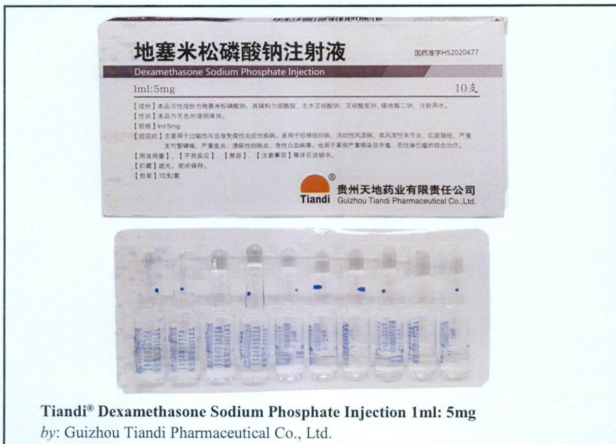
Tiandi® Dexamethasone Sodium Phosphate Injection 1ml: 5mg by: Guizhou Tiandi Pharmaceutical Co., Ltd.