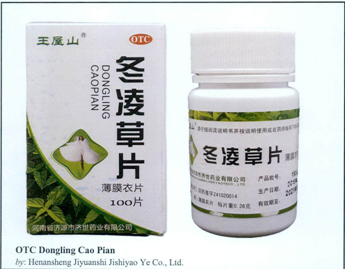
OTC Dongling Cao Pian

by: Henansheng Jiyuanshi Jishiyao Ye Co., Ltd.