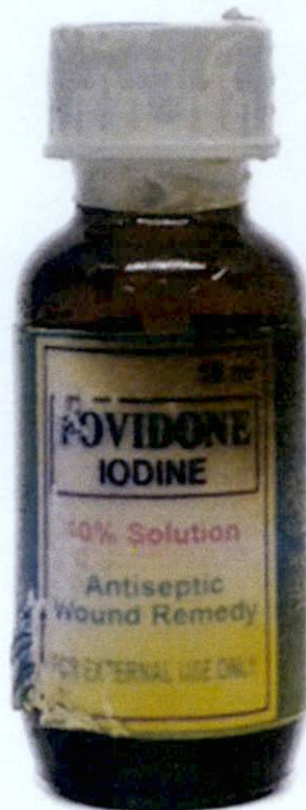
POVIDONE IODINE 10% Solution 15ml by: Neo-Era Industry – Malabon M.M.