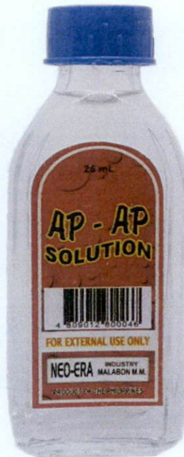
AP – AP Solution 25 mL by: Neo-Era Industry – Malabon M.M.