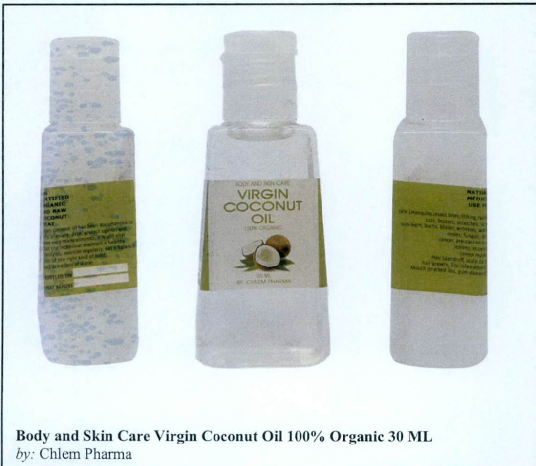
Body and Skin Care Virgin Coconut Oil 100% Organic 30 ML by: Chlem Pharma

Pinapayuhan ng Food and Drug Administration (FDA) ang publiko laban sa pagbili at paggamit ng mga hindi rehistradong gamot na: