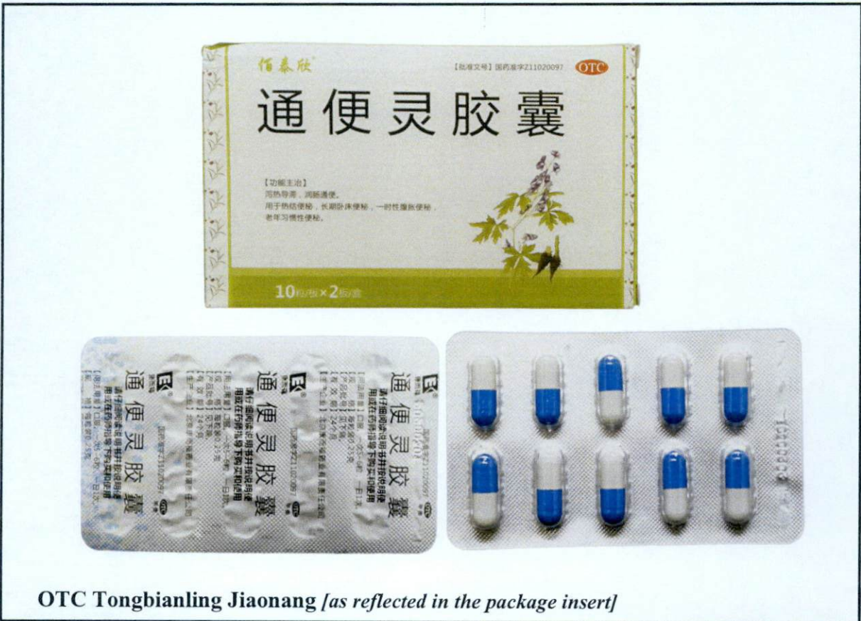
Larawan 3. Hindi rehistradong gamot