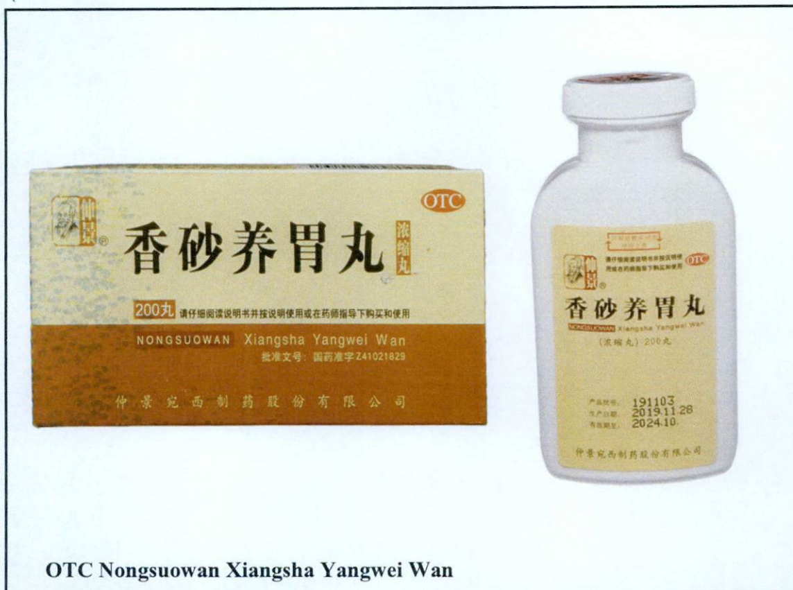
OTC Nongsuowan Xiangsha Yangwei Wan