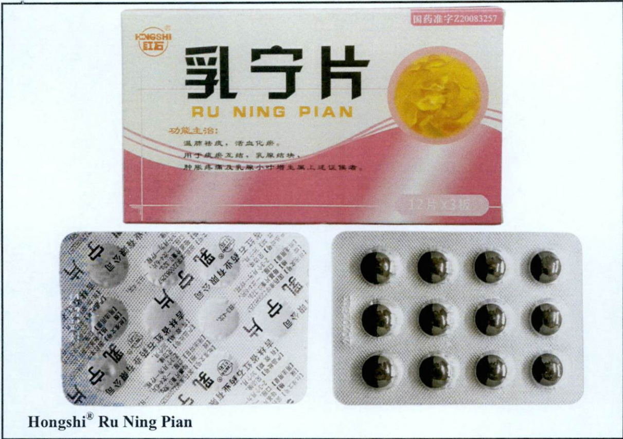
Larawan 2. Hindi rehistradong gamot