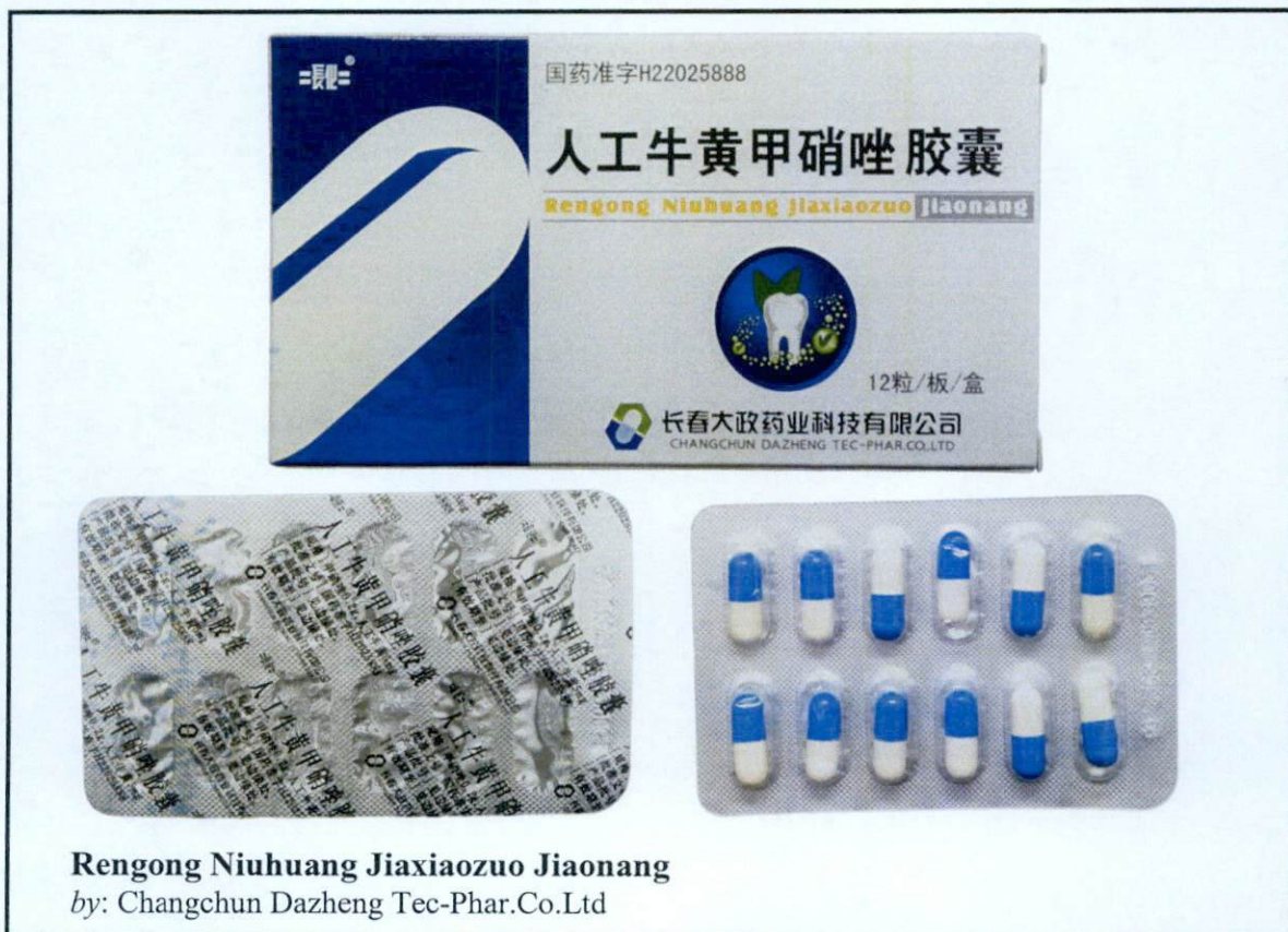
Rengong Niuhuang Jiaxiaozuo Jiaonang by: Changchun Dazheng Tec-Phar.Co.Ltd

Pinapayuhan ng Food and Drug Administration (FDA) ang publiko laban sa pagbili at paggamit ng mga sumusunod na hindi rehistradong gamot: