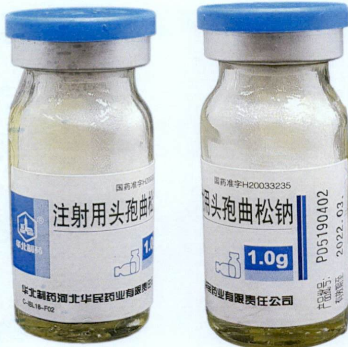
H20033235 1.0g [Label in Foreign Language]