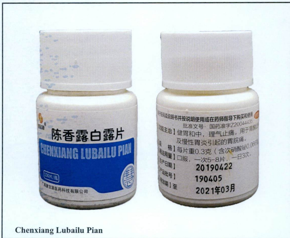
Chenxiang Lubailu Pian

Pinapayuhan ng Food and Drug Administration (FDA) ang publiko laban sa pagbili at paggamit ng mga sumusunod na hindi rehistradong gamot: