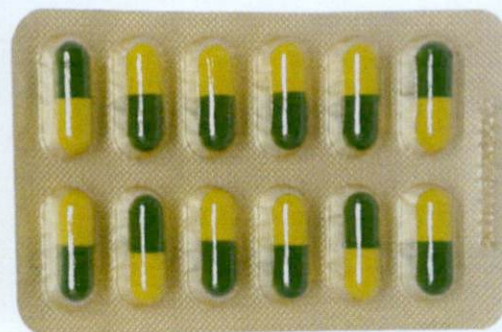
OTC Yinhuang JiaoNang