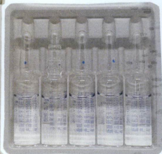
Lidocaine Hydrochloride Injection 5ml: 0.1g