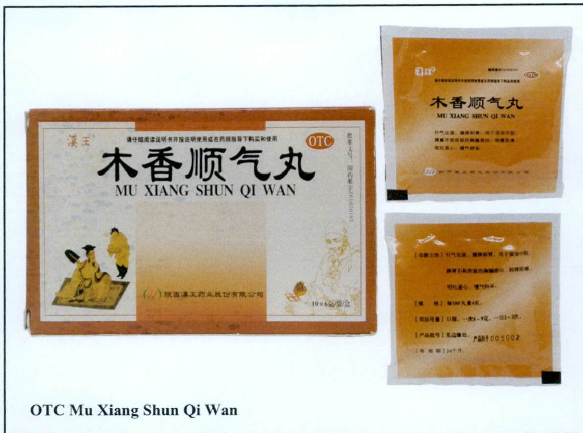
OTC Mu Xiang Shun Qi Wan