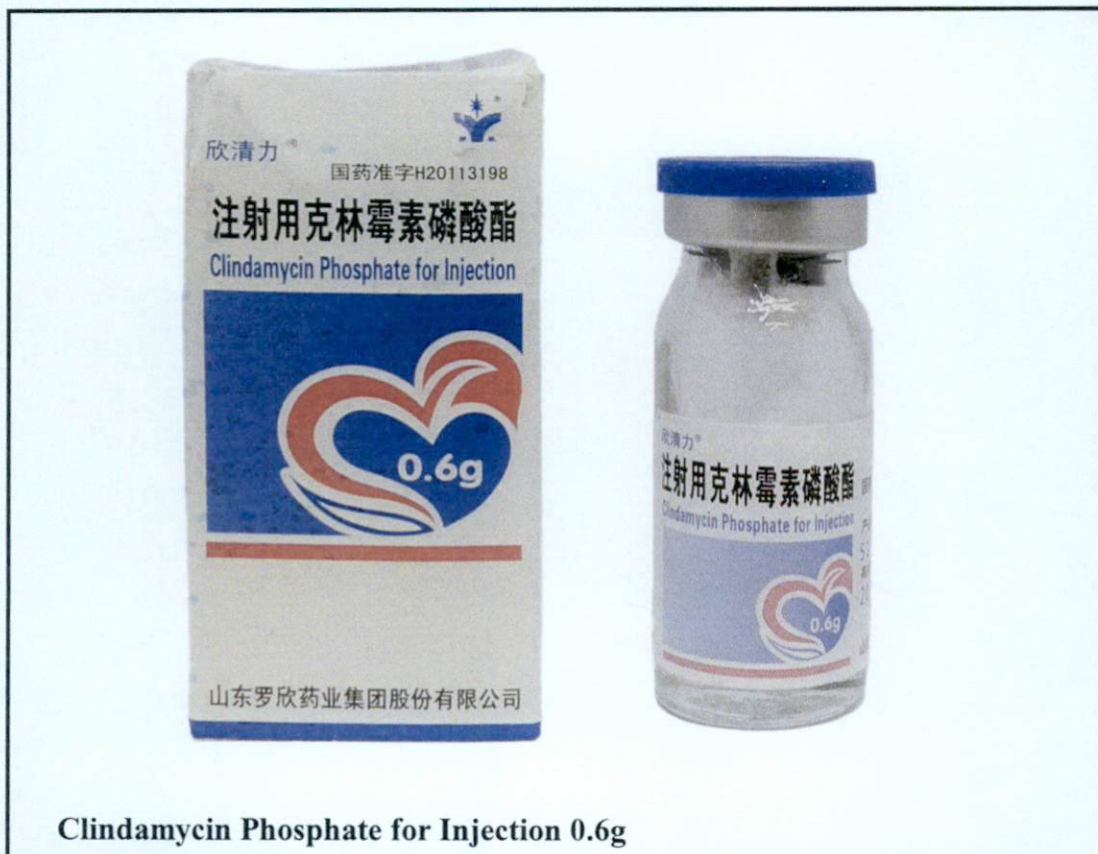
Clindamycin Phosphate for Injection 0.6g

Pinapayuhan ng Food and Drug Administration (FDA) ang publiko laban sa pagbili at paggamit ng mga sumusunod na hindi rehistradong gamot: