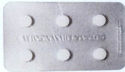
OTC Bye Allergy Loratadine Tablets

by: Venturepharma Pharmaceutical (Xiamen) Co., Ltd