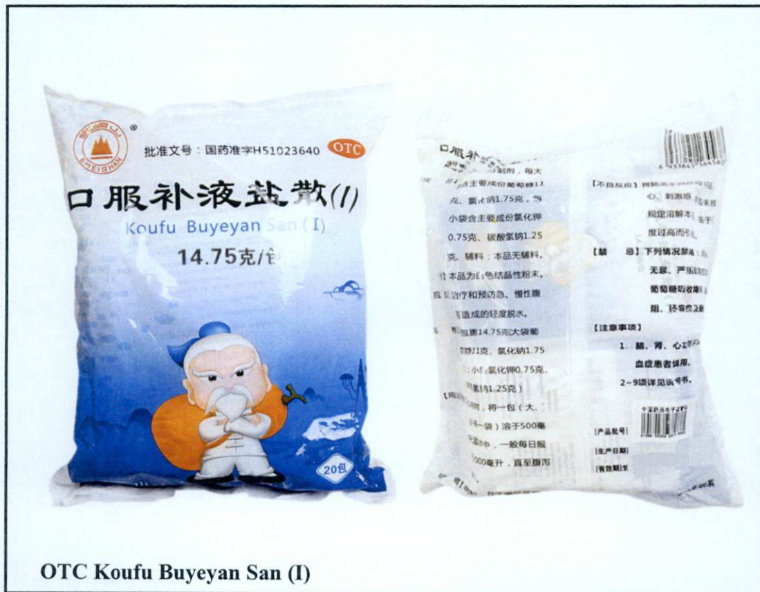
OTC Koufu Buyeyan San (I)

Pinapayuhan ng Food and Drug Administration (FDA) ang publiko laban sa pagbili at paggamit ng mga sumusunod na hindi rehistradong gamot: