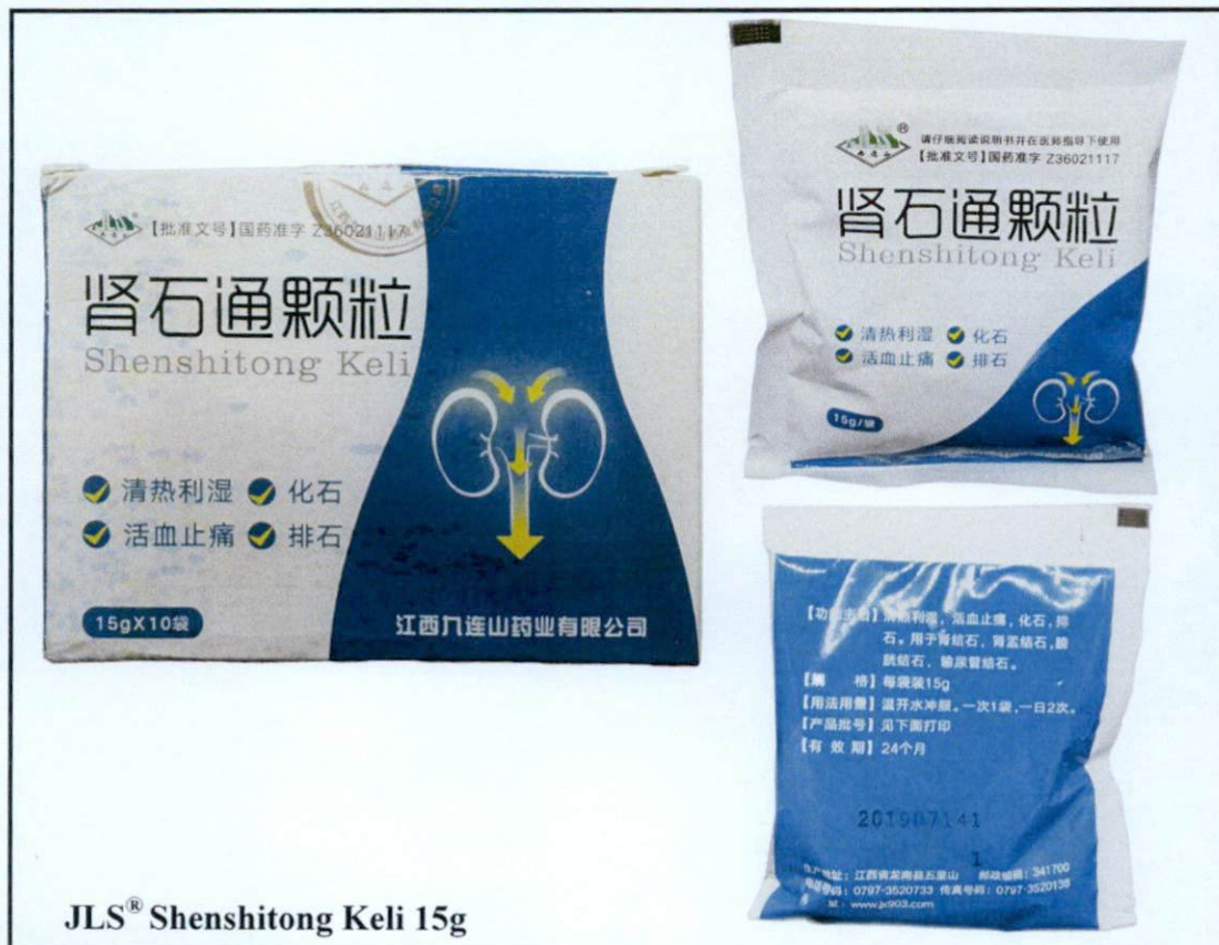
JLS® Shenshitong Keli 15g

Pinapayuhan ng Food and Drug Administration (FDA) ang publiko laban sa pagbili at paggamit ng mga sumusunod na hindi rehistradong gamot: