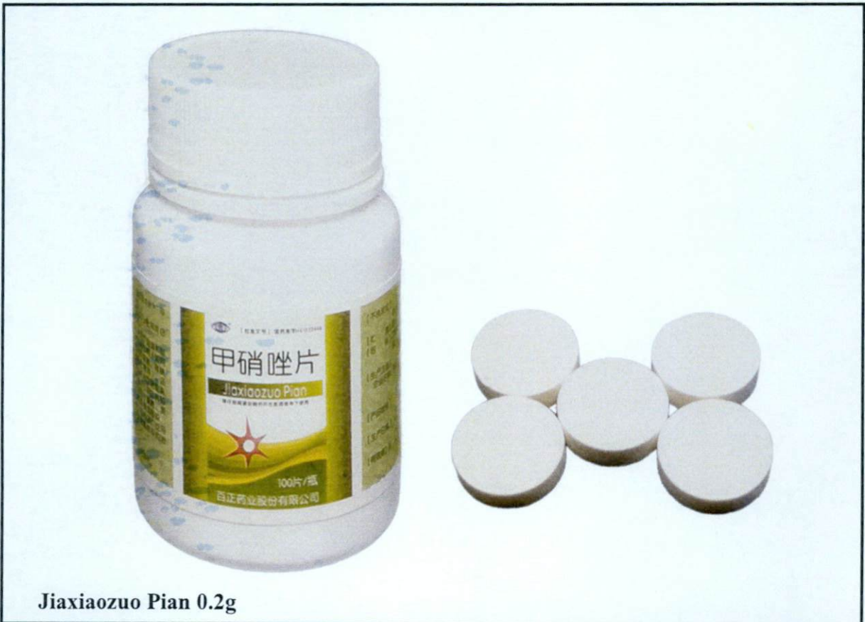
Ji Xiaozuo Pian 0.2g