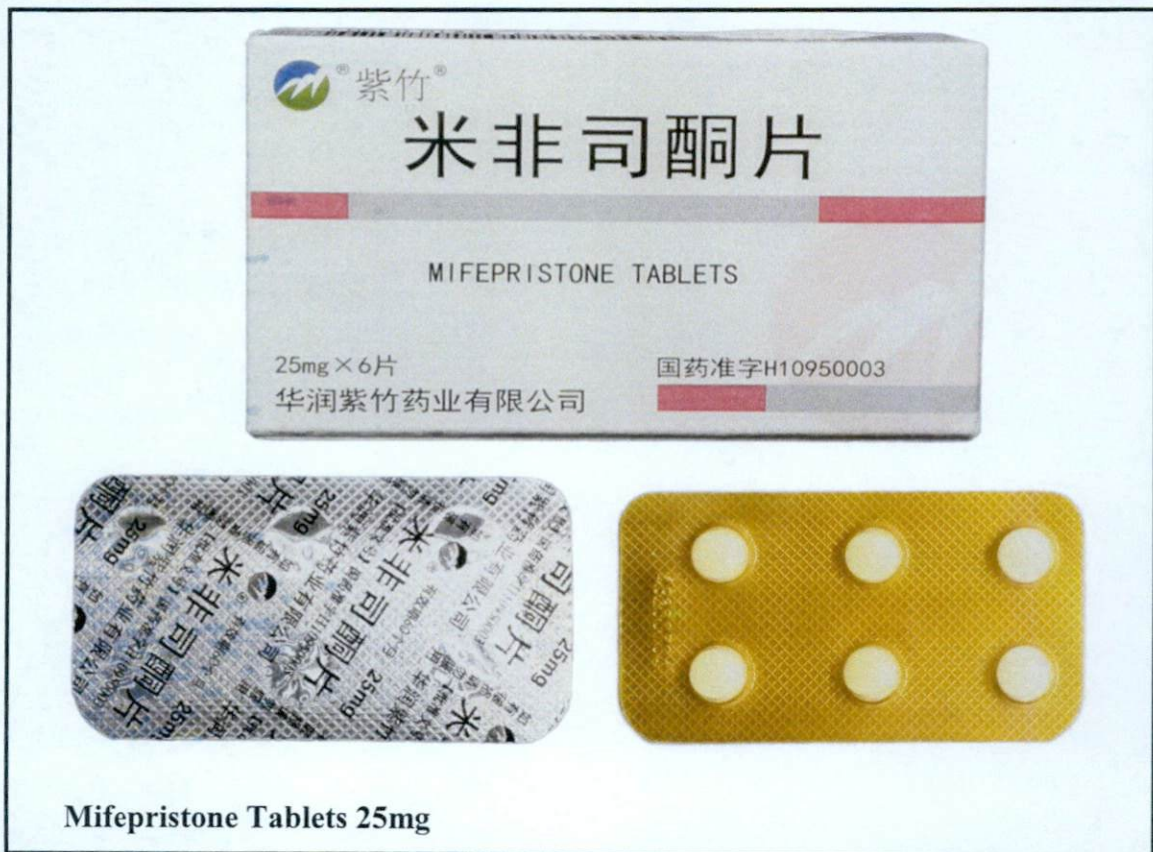
Mifepristone Tablets 25mg