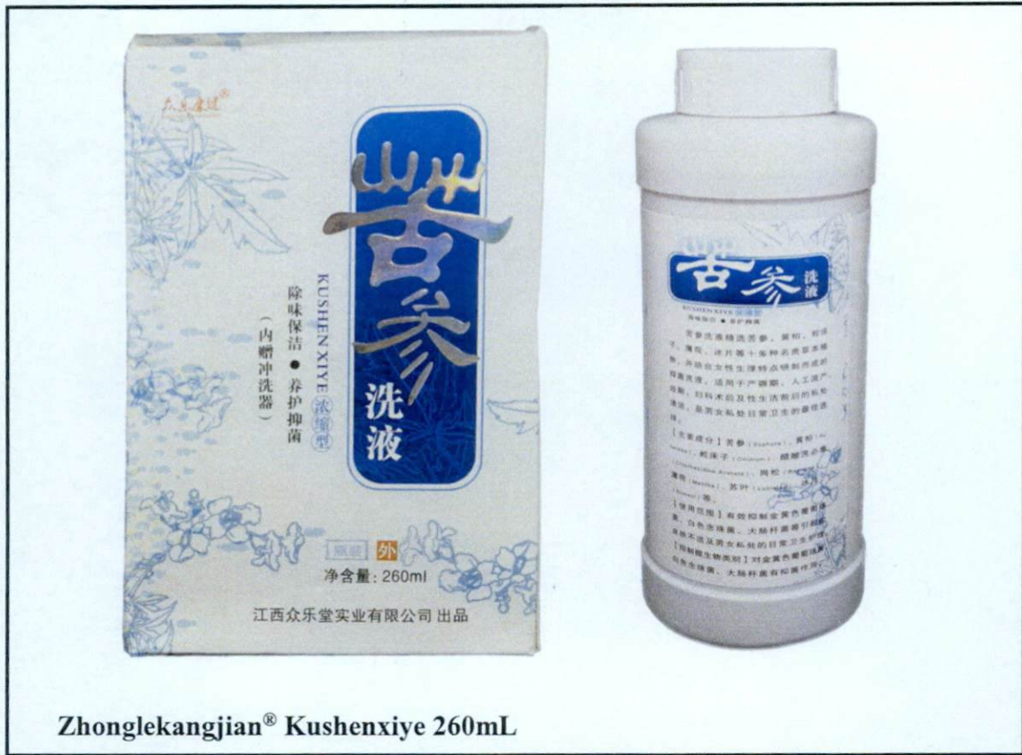
Zhonglekangjian® Kushenxiye 260mL