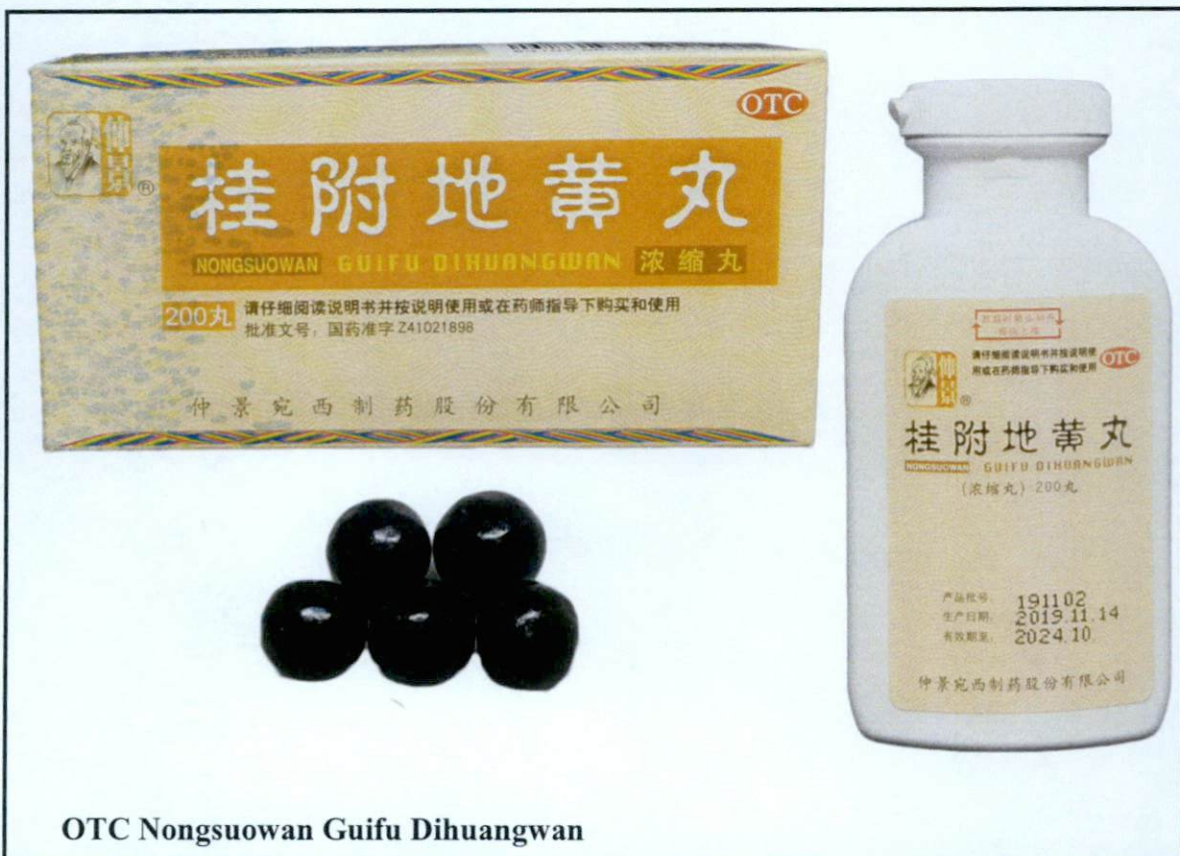
OTC Nongsuowan Guifu Dihuangwan

Pinapayuhan ng Food and Drug Administration (FDA) ang publiko laban sa pagbili at paggamit ng mga sumusunod na hindi rehistradong gamot: