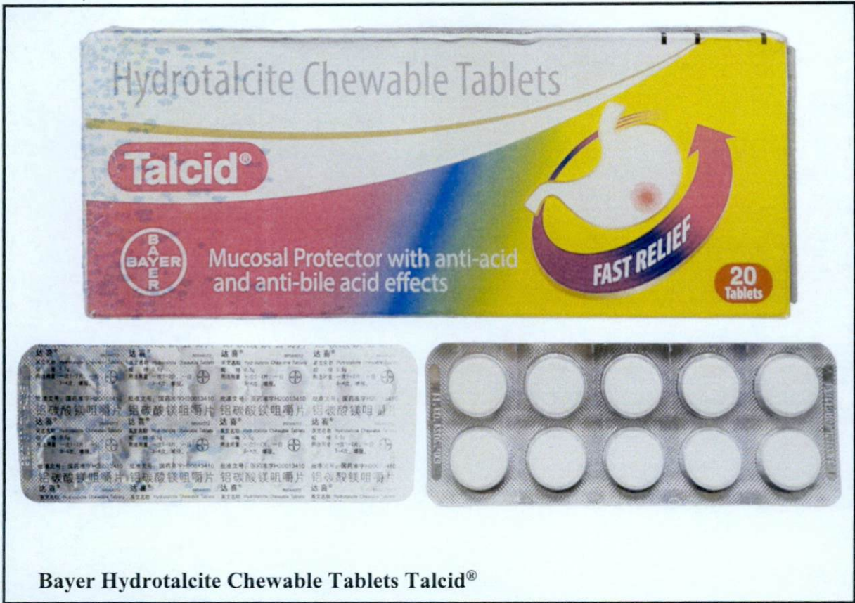
Bayer Hydrotalcite Chewable Tablets Talcid®