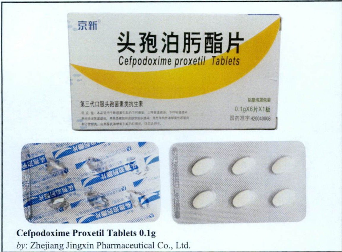
Larawan 4. Hindi rehistradong gamot