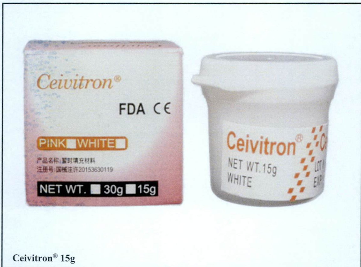
Larawan 5. Hindi rehistradong gamot