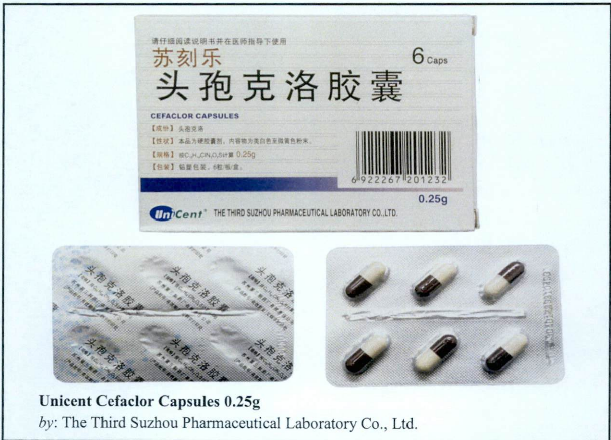
Unicent Cefaclor Capsules 0.25g

by: The Third Suzhou Pharmaceutical Laboratory Co., Ltd.