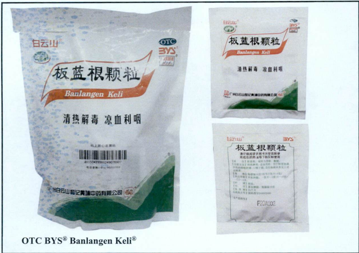
OTC BYS® Banlangen Keli®