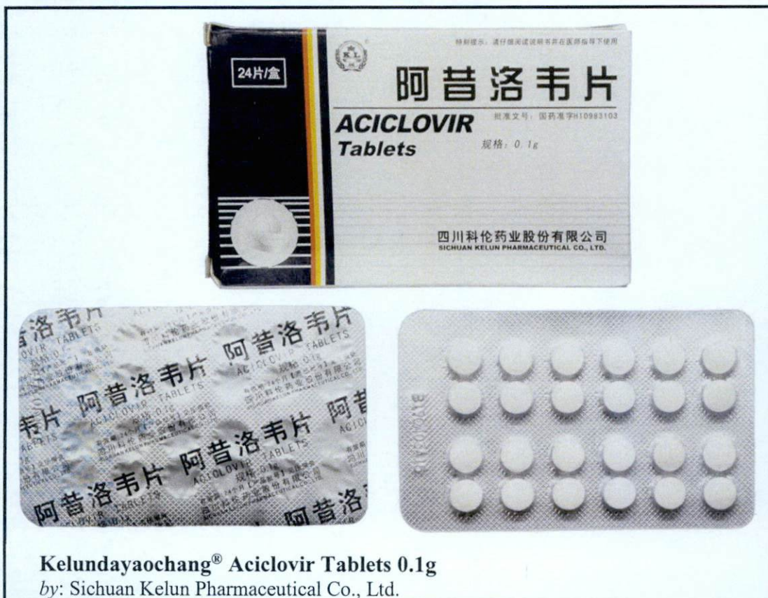
Larawan 1. Hindi rehistradong gamot

Pinapayuhan ng Food and Drug Administration (FDA) ang publiko laban sa pagbili at paggamit ng mga sumusunod na hindi rehistradong gamot: