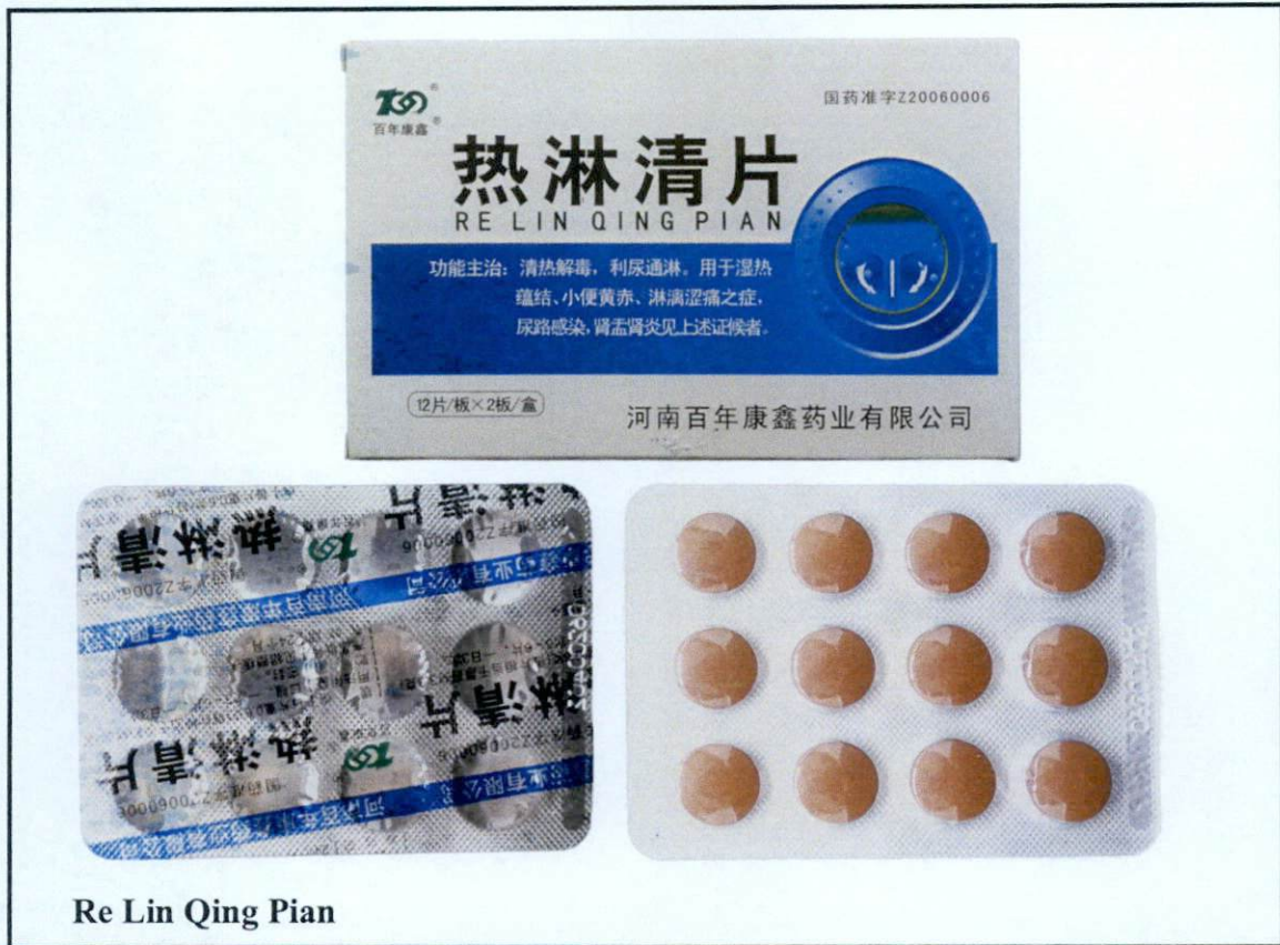
Re Lin Qing Pian