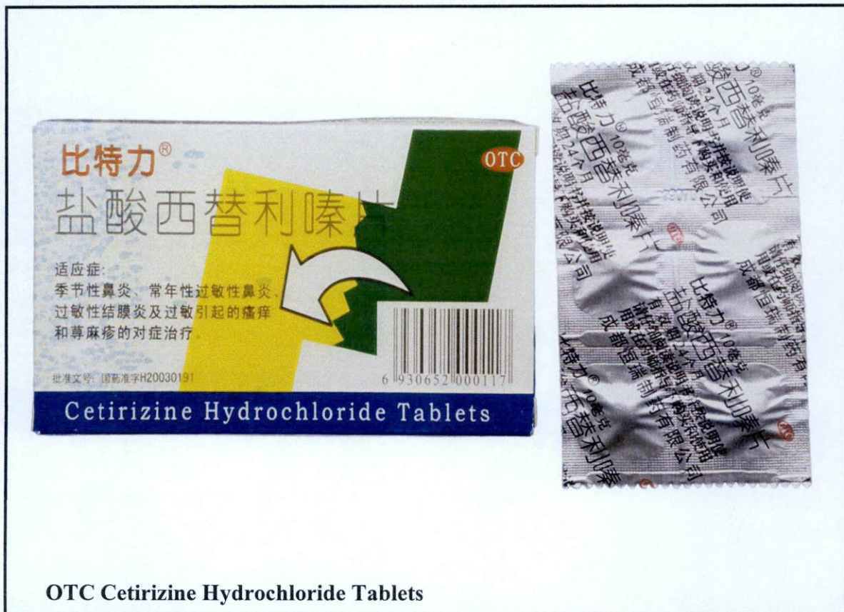
OTC Cetirizine Hydrochloride Tablets

Pinapayuhan ng Food and Drug Administration (FDA) ang publiko laban sa pagbili at paggamit ng mga sumusunod na hindi rehistradong gamot: