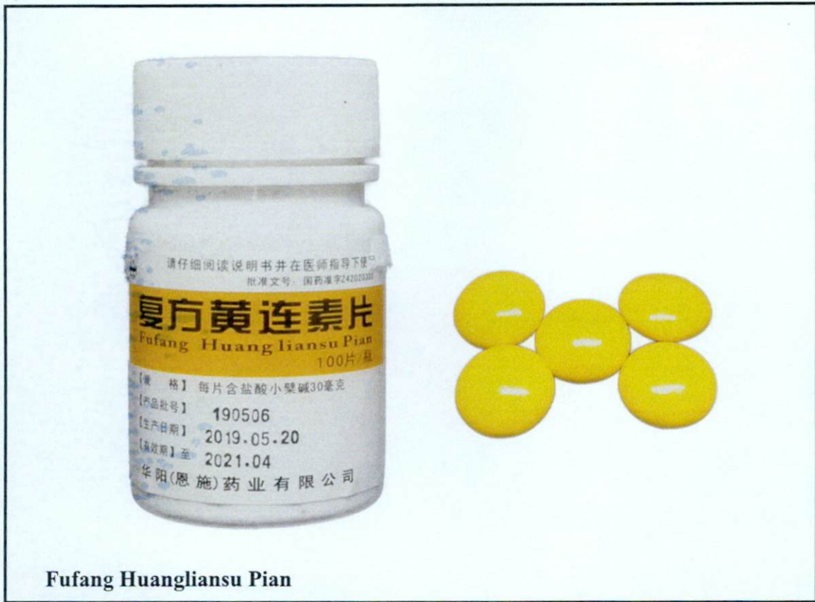
Fufang Huangliansu Pian