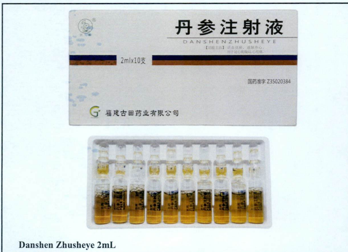
Danshen Zhusheye 2mL

Pinapayuhan ng Food and Drug Administration (FDA) ang publiko laban sa pagbili at paggamit ng mga sumusunod na hindi rehistradong gamot: