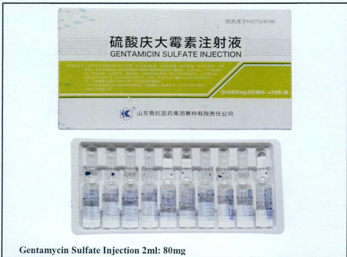
Gentamycin Sulfate Injection 2ml: 80mg