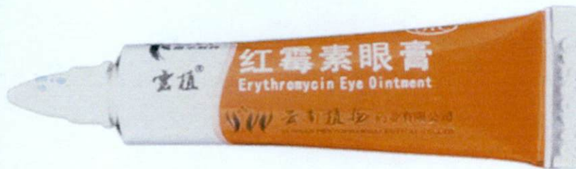
OTC ZHPF® Erythromycin Eye Ointment

by: Yunnan Phytopharmaceutical Co., Ltd.