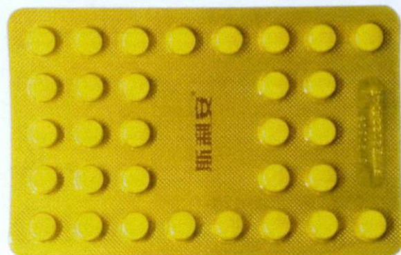
OTC Folic Acid Tablets 0.4mg