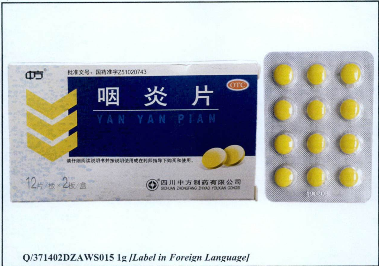
Larawan 2. Hindi rehistradong gamot