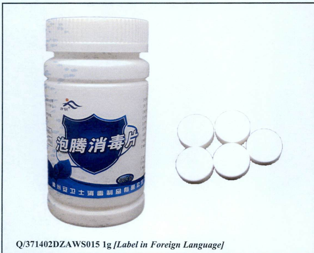
Larawan 1. Hindi rehiistradong gamot

Pinapayuhan ng Food and Drug Administration (FDA) ang publiko laban sa pagbili at paggamit ng mga hindi rehiistradong gamot na: