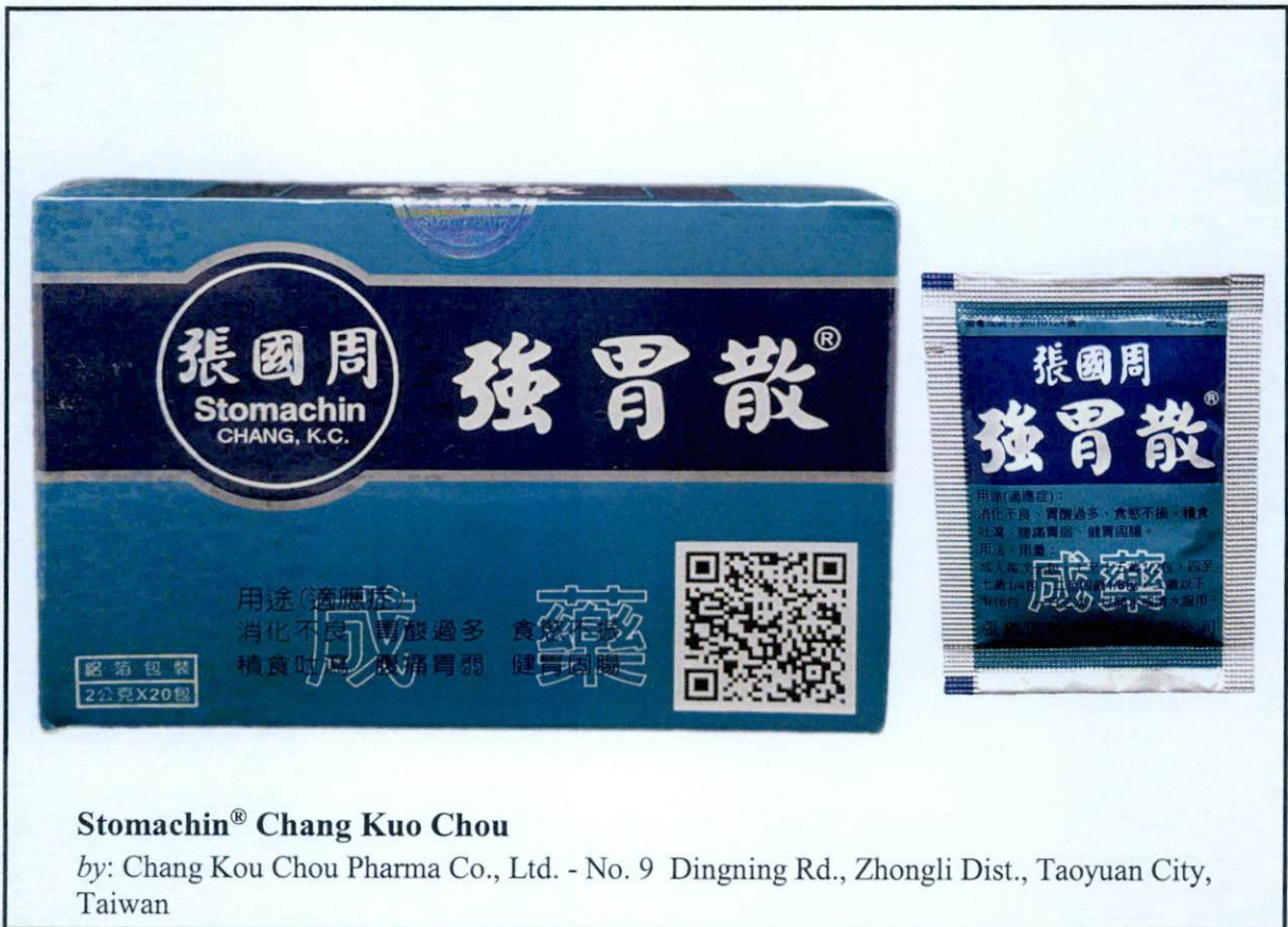
Larawan 3. Hindi rehistradong gamot