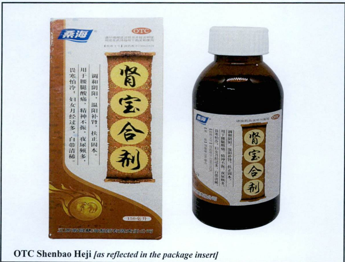
OTC Shenbao Heji [as reflected in the package insert]