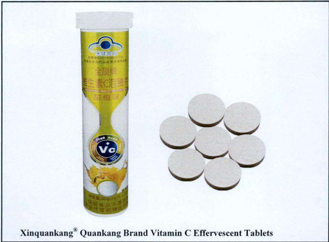
Xinquankang® Quankang Brand Vitamin C Effervescent Tablets