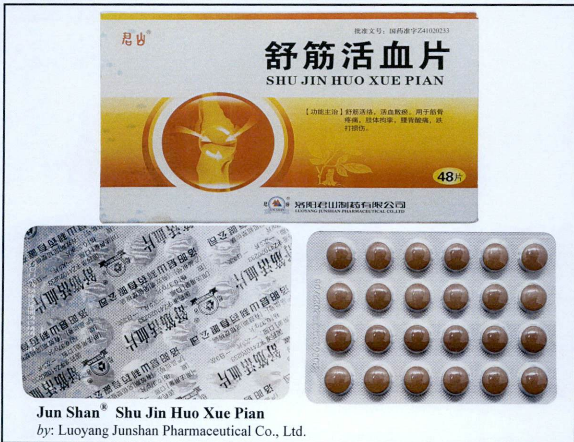
Jun Shan® Shu Jin Huo Xue Pian by: Luoyang Junshan Pharmaceutical Co., Ltd.

Pinapayuhan ng Food and Drug Administration (FDA) ang publiko laban sa pagbili at paggamit ng mga sumusunod na hindi rehistradong gamot: