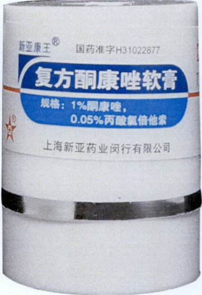
Compound Ketoconazole Cream