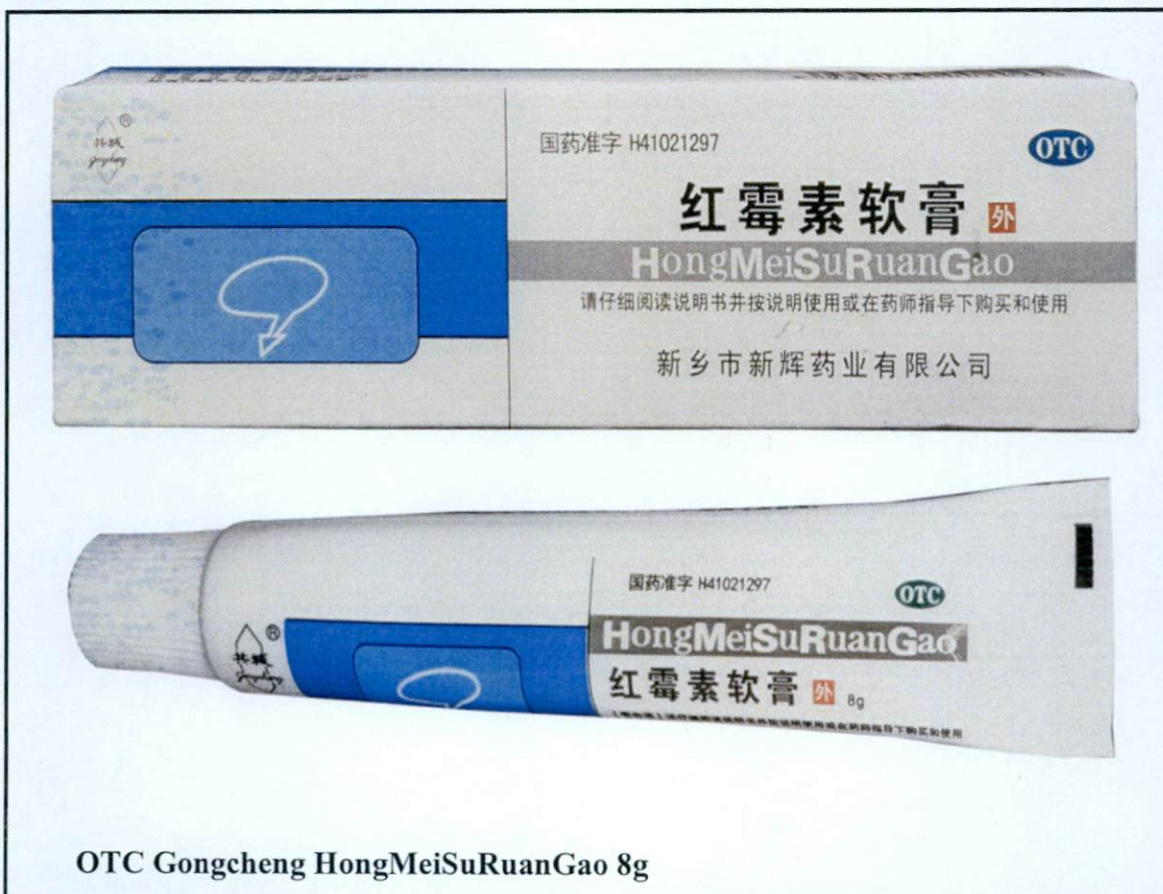
OTC Gongcheng HongMeiSuRuanGao 8g

Pinapayuhan ng Food and Drug Administration (FDA) ang publiko laban sa pagbili at paggamit ng mga sumusunod na hindi rehiistradong gamot: