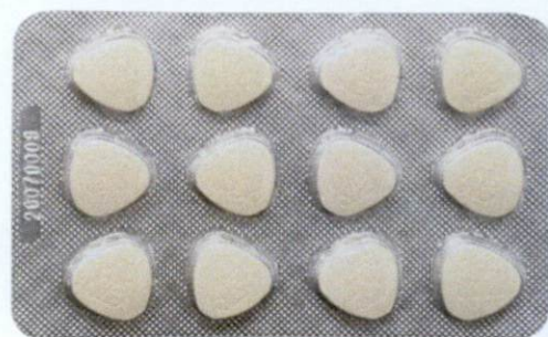
OTC JZJT Jianwei Xiaoshi Pian