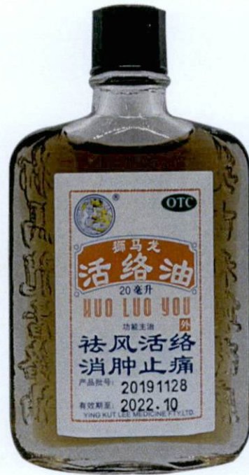
OTC Huo Luo You by: Ying Kut Lee Medicine Fty. Ltd.