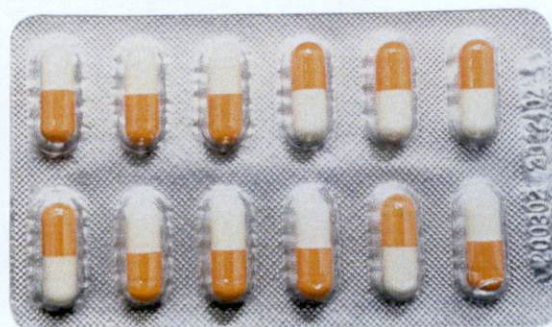
Golden Sun Norfloxacin Capsules 0.1g