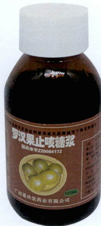
OTC Luohanguo Zhike Tangjiang 100ml