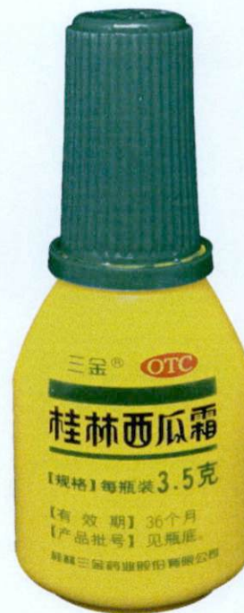
OTC Guilin Watermelon Frost by: Guilin Sanjin Pharmaceutical Co., Ltd.