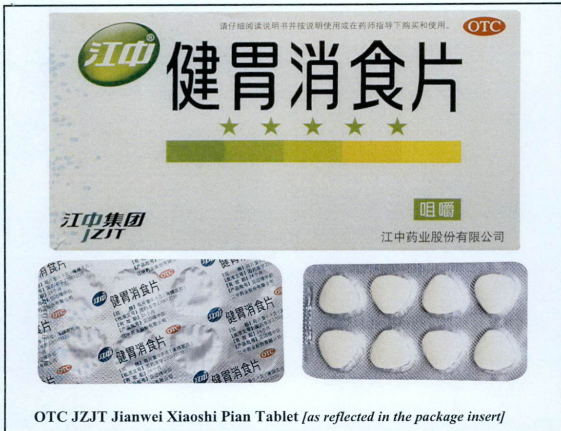
Larawan 4. Hindi rehistradong gamot

Napatunayan sa pamamagitan ng isinagawang Post-Marketing Surveillance (PMS) ng FDA na ang mga nasabing gamot ay hindi dumaaan sa proseso ng rehistrasyon ng Ahensya at hindi nabigyan ng kaukulang awtorisasyon tulad ng Certificate of Product Registration (CPR). Dahil dito, hindi masisiguro ng Ahensya ang kalidad, kaligtasan at bisa nito. Samakatuwid, ang paggamit ng nasabing mga ilegal na produkto ay maaaring magdulot ng panganib sa kalusugan.