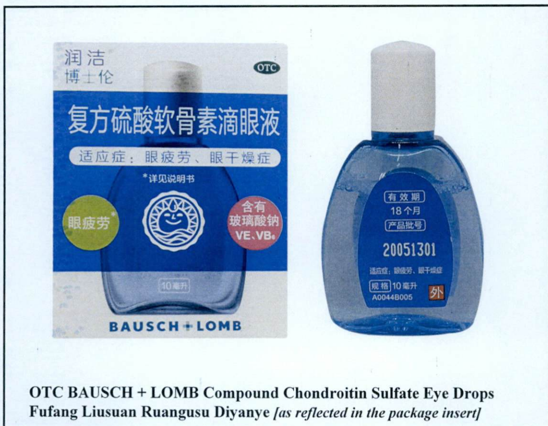
Larawan 1. Hindi rehistradong gamot

Pinapayuhan ng Food and Drug Administration (FDA) ang publiko laban sa pagbili at paggamit ng mga sumusunod na hindi rehistradong gamot: