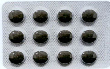
OTC CONBA Changyanning Pian [as reflected in the package insert]