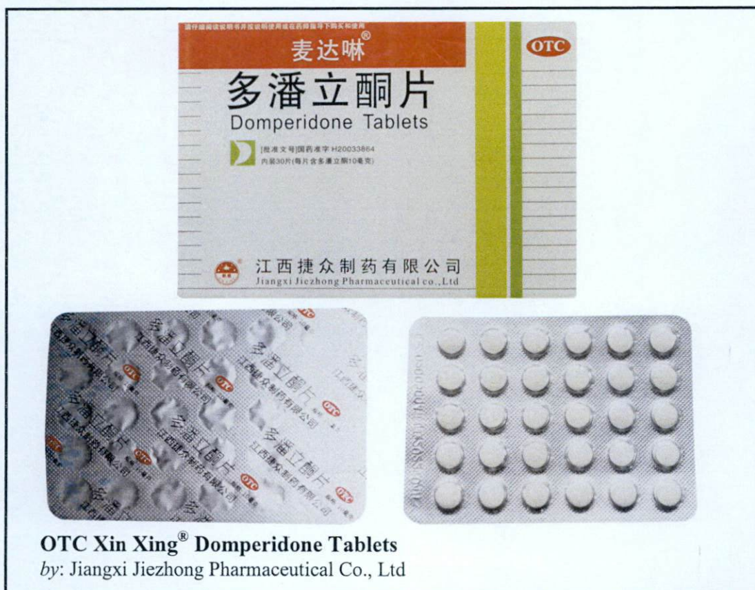
OTC Xin Xing® Domperidone Tablets by: Jiangxi Jiezhong Pharmaceutical Co., Ltd

Pinapayuhan ng Food and Drug Administration (FDA) ang publiko laban sa pagbili at paggamit ng mga sumusunod na hindi rehistradong gamot: