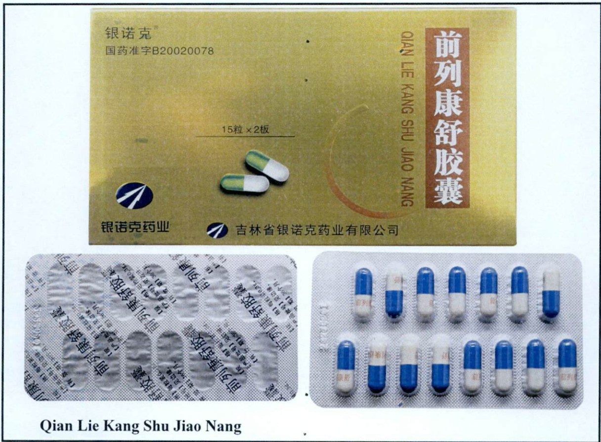
Qian Lie Kang Shu Jiao Nang