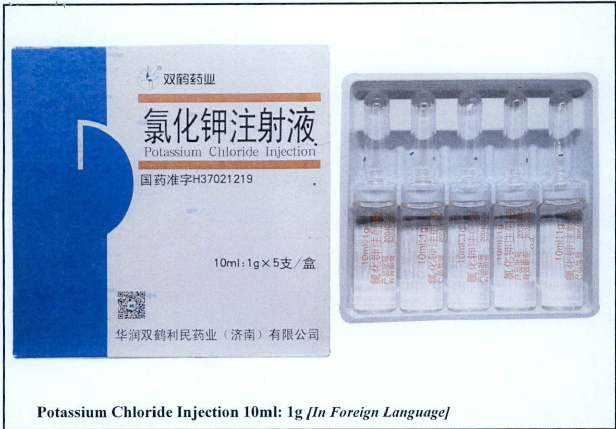
Potassium Chloride Injection 10ml: 1g [In Foreign Language]