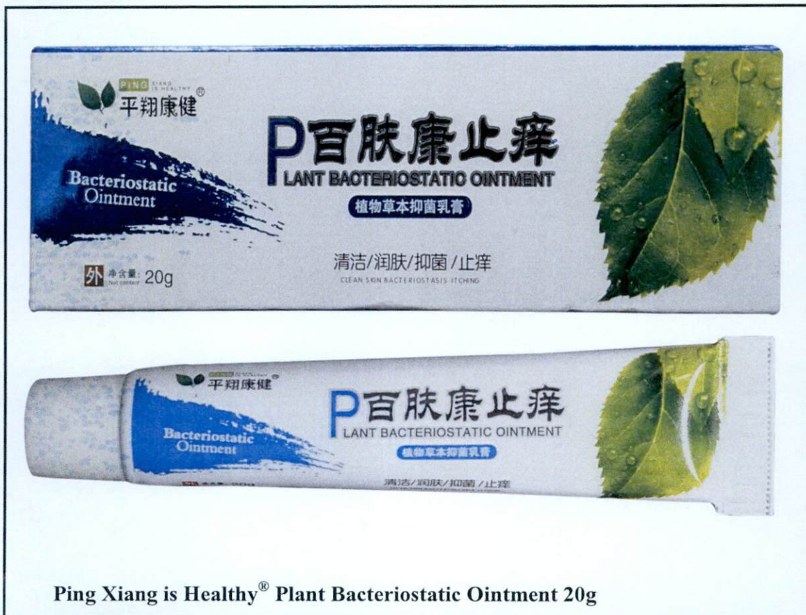
Ping Xiang is Healthy® Plant Bacteriostatic Ointment 20g

Pinapayuhan ng Food and Drug Administration (FDA) ang publiko laban sa pagbili at paggamit ng mga sumusunod na hindi rehistradong gamot: