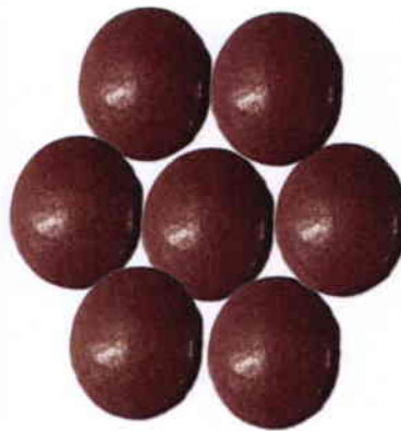
Yabang Group Carbazochrome Tablets 2.5mg by: Yabang Pharma