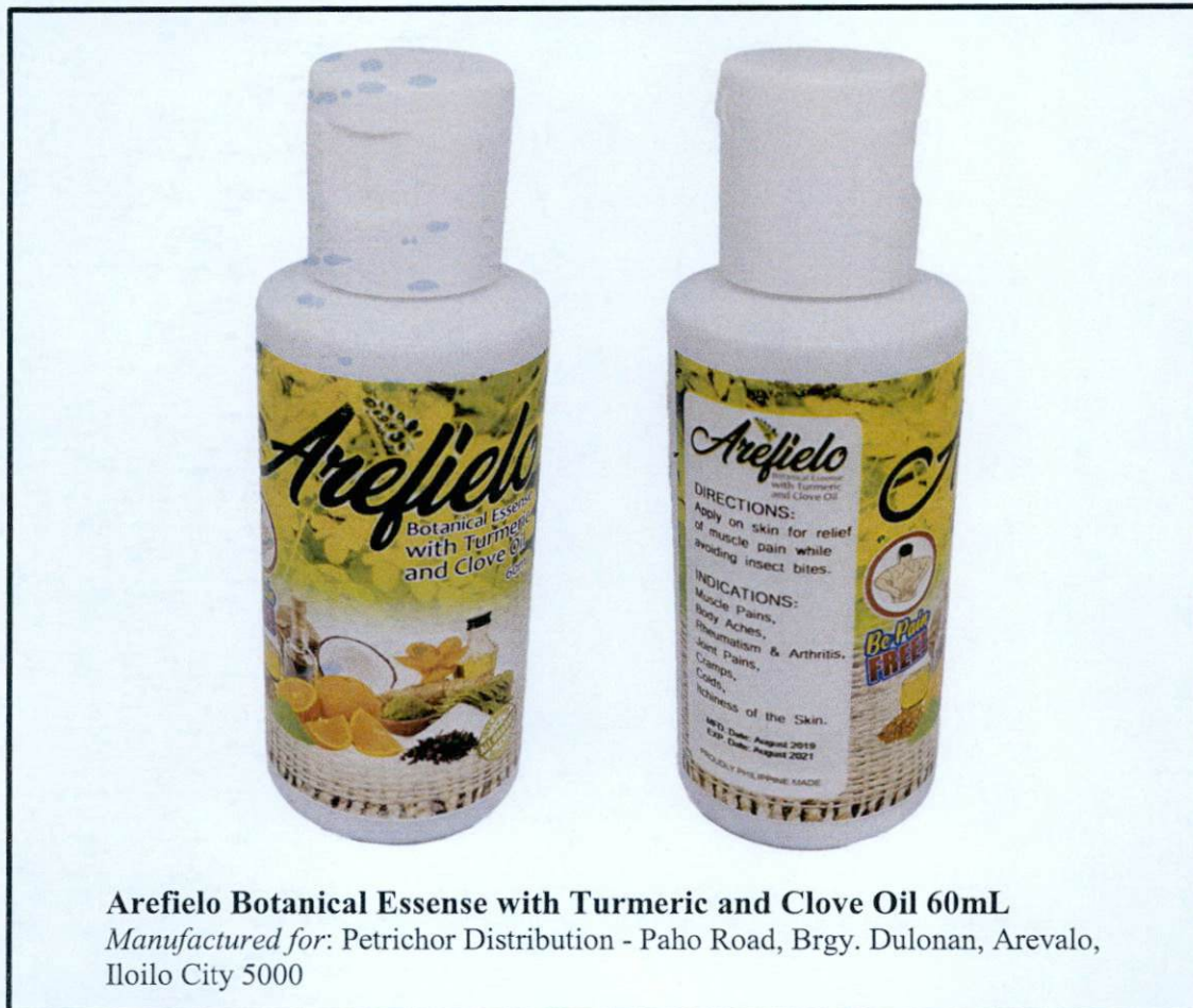
Larawan 1. Hindi rehistradong gamot

Pinapayuhan ng Food and Drug Administration (FDA) ang publiko laban sa pagbili at paggamit ng hindi rehistradong gamot na: