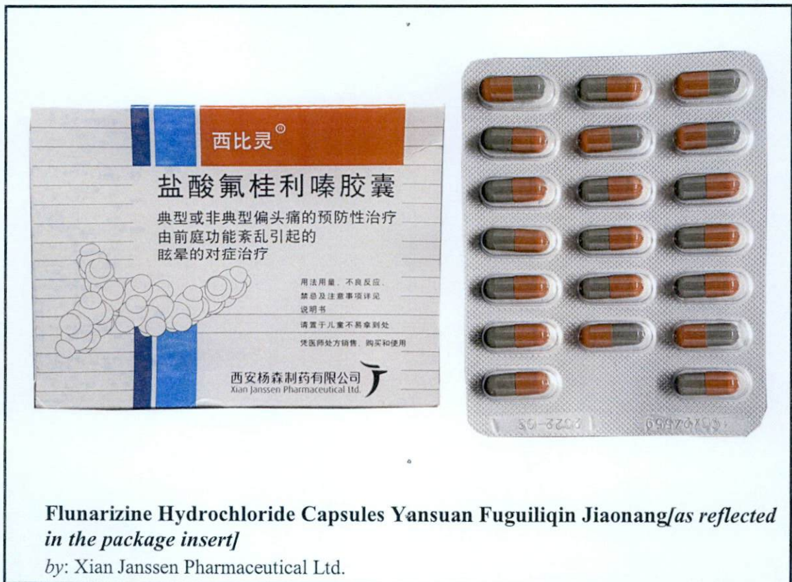
Flunarizine Hydrochloride Capsules Yansuan Fuguiliqin Jiaonang [as reflected in the package insert]