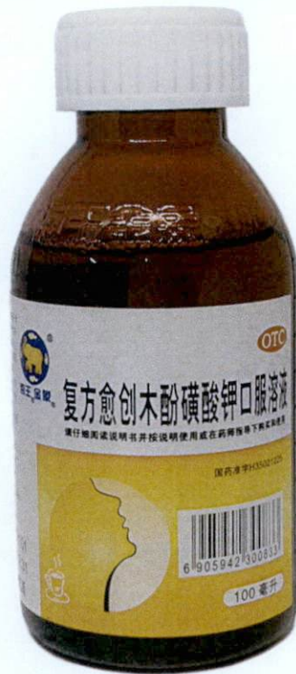
OTC H35021225 [Label in Foreign Language]