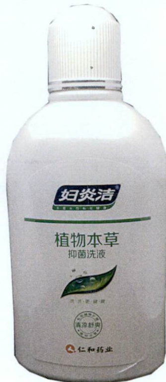
[Label in Foreign Language] 380mL