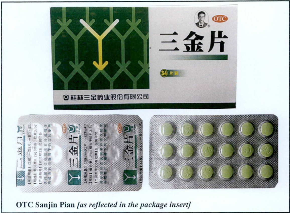
OTC Sanjin Pian [as reflected in the package insert]