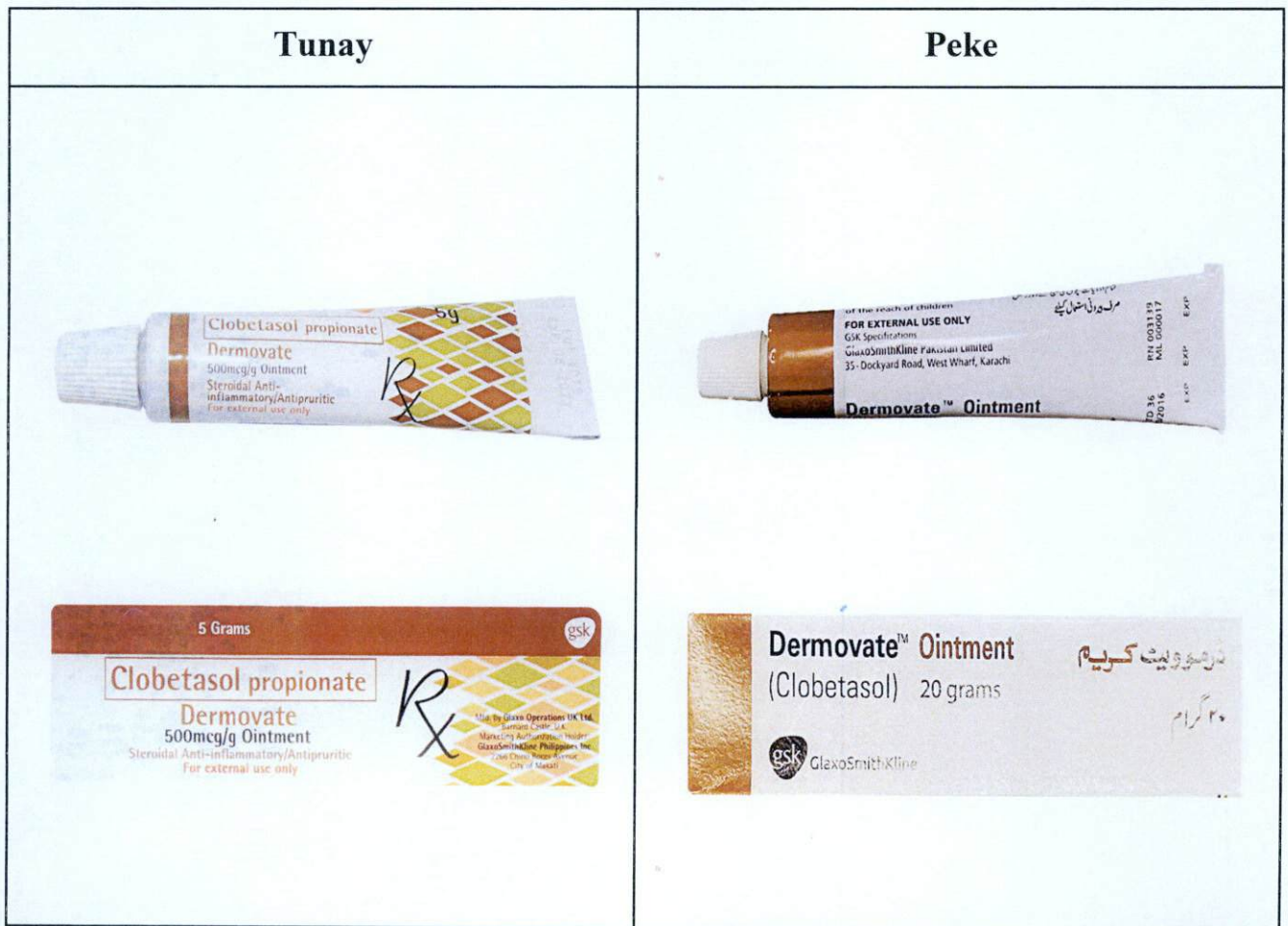
Larawan 1. Paghahambing sa Tunay/Authentic at Peke/Counterfeit na Dermovate™ Ointment (Clobetasol)

Pinapayuhan ng Food and Drug Administration (FDA) ang publiko laban sa pagbili at paggamit ng mga pekeng bersyon ng Dermovate™ Ointment (Clobetasol) 20 grams: