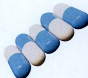
New Quick Rheumatism Capsule Tiger Wang Biaod 20 caps by: Hong Pin Medicine (HK) Corporation