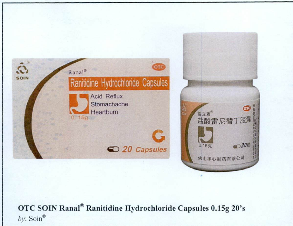
OTC SOIN Ranal® Ranitidine Hydrochloride Capsules 0.15g 20's by: Soin®