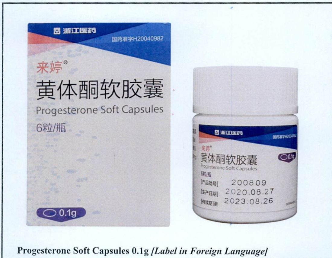
Progesterone Soft Capsules 0.1g [ Label in Foreign Language ]

Pinapayuhan ng Food and Drug Administration (FDA) ang publiko laban sa pagbili at paggamit ng mga sumusunod na hindi rehistradong gamot: