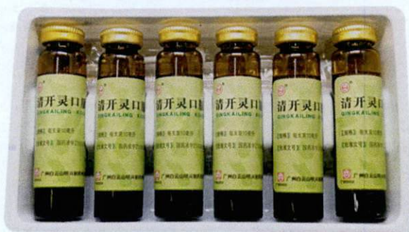
OTC Qingkailing Koufuye