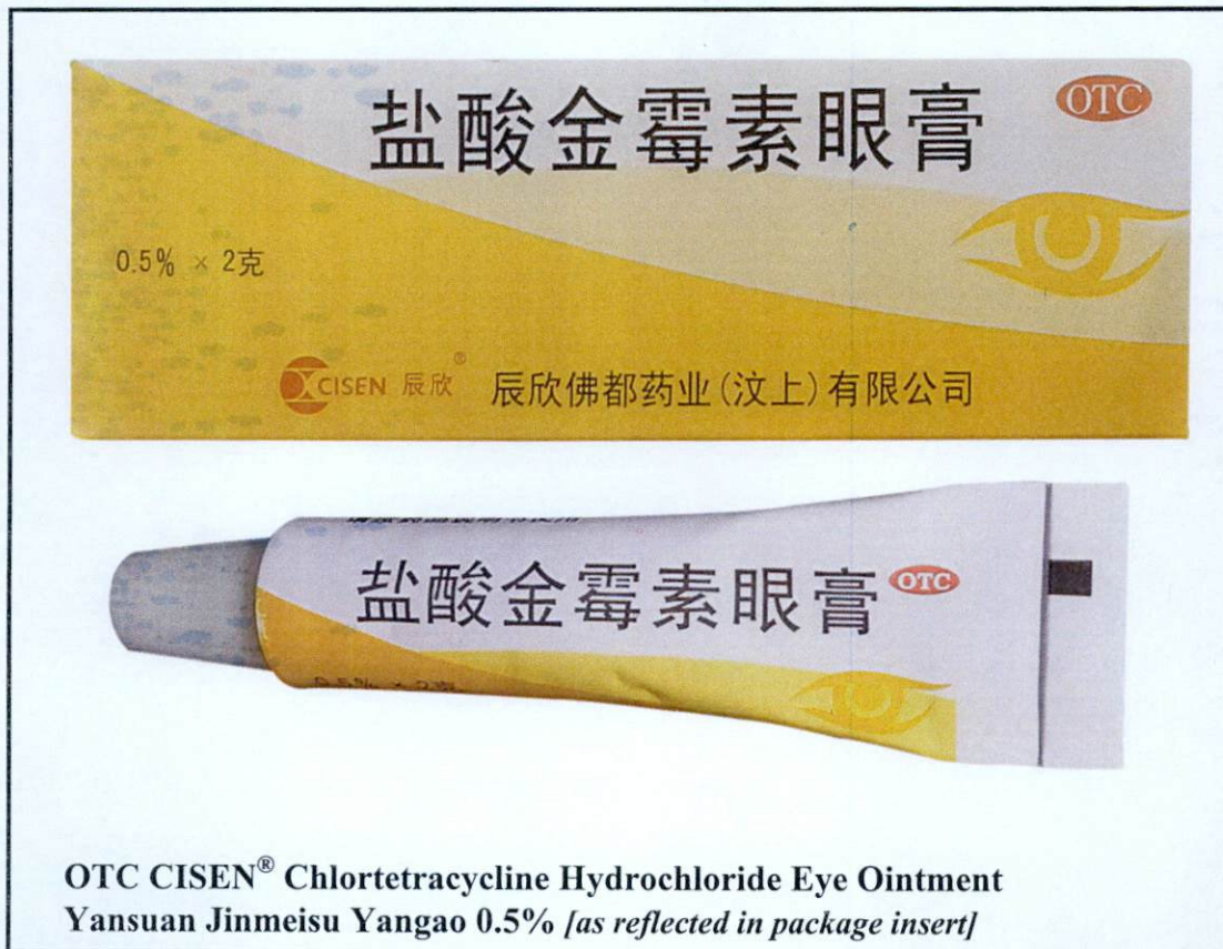
Larawan 1. Hindi rehistradong gamot

Pinapayuhan ng Food and Drug Administration (FDA) ang publiko laban sa pagbili at paggamit ng mga sumusunod na hindi rehistradong gamot: