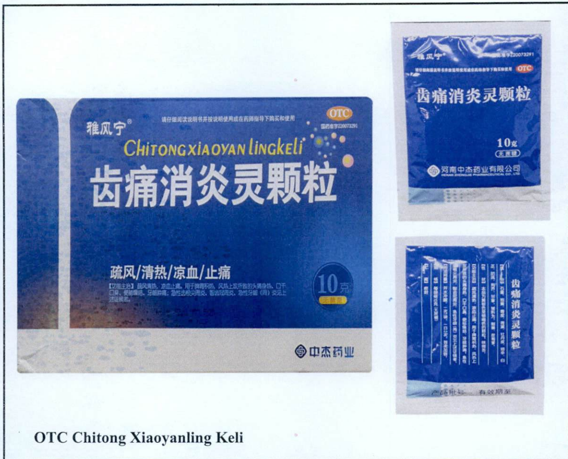
Larawan 4. Hindi rehistradong gamot

Napatunayan sa pamamagitan ng isinagawang Post-Marketing Surveillance (PMS) ng FDA na ang mga nasabing gamot ay hindi dumaaan sa proseso ng rehistrasyon ng Ahensya at hindi nabigyan ng kaukulang awtorisasyon tulad ng Certificate of Product Registration (CPR). Dahil dito, hindi masisiguro ng Ahensya ang kalidad, kaligtasan at bisa nito. Samakatuwid, ang paggamit ng nasabing mga ilegal na produkto ay maaaring magdulot ng panganib sa kalusugan.