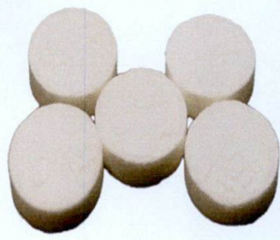
OTC B 1 H42020611 [Label in Foreign Language] by: Huazhong Pharmaceutical., Co., Ltd