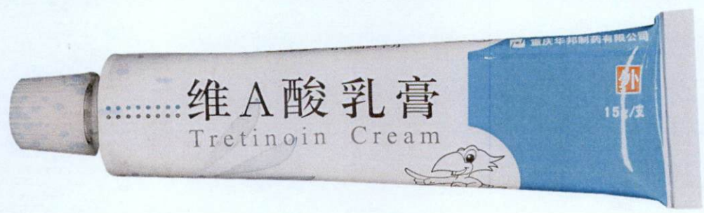
A Tretinoin Cream 0.025% 15 g by: Chongqing Huapont Pharm. Co., Ltd.