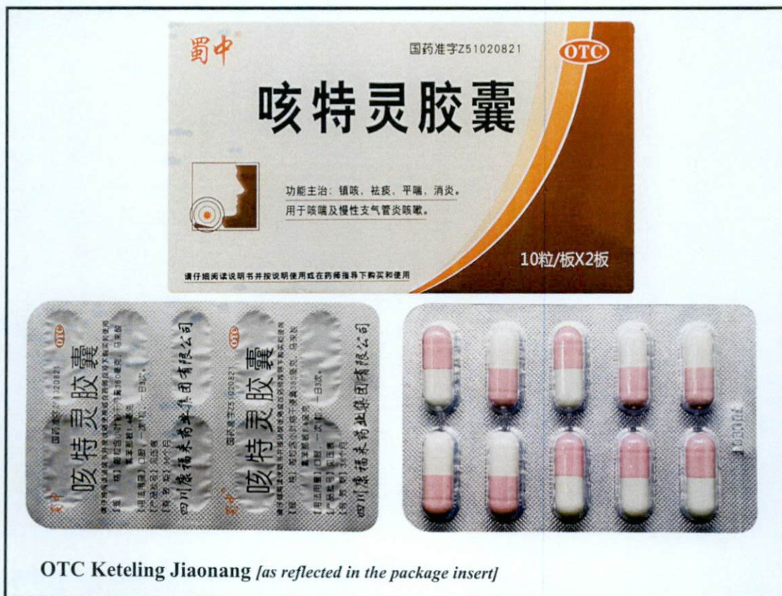
OTC Keteling Jiaonang [as reflected in the package insert]

Pinapayuhan ng Food and Drug Administration (FDA) ang publiko laban sa pagbili at paggamit ng mga sumusunod na hindi rehistradong gamot: