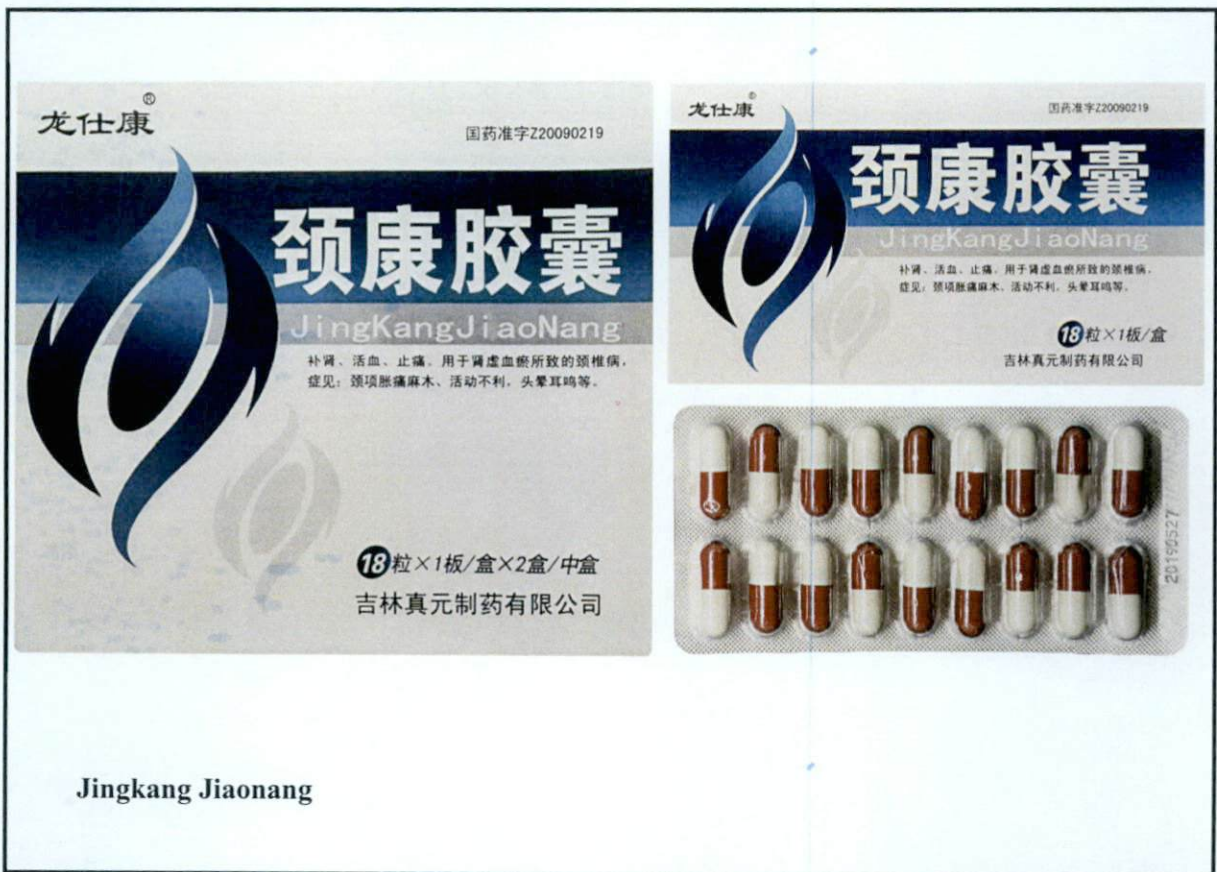
Larawan 3. Hindi rehistradong gamot