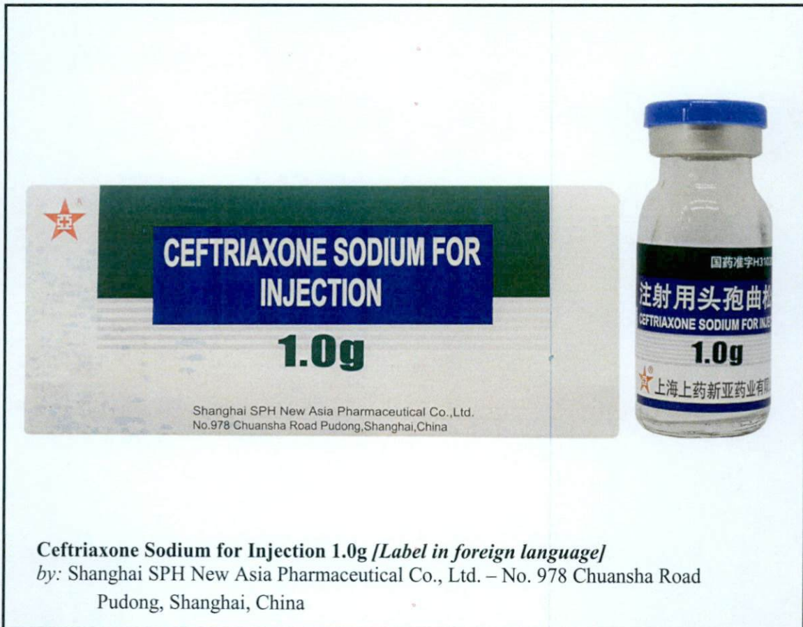
Larawan 5. Hindi rehistradong gamot