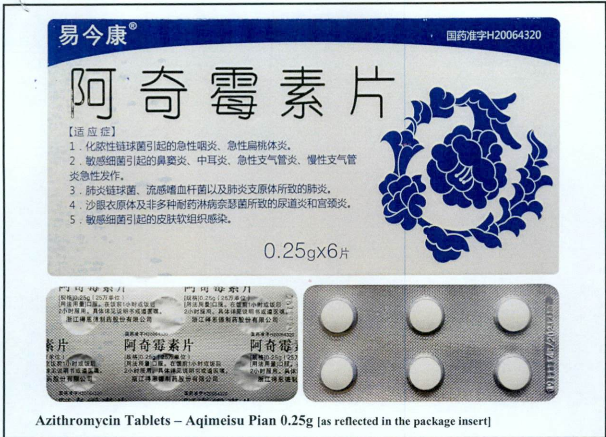
Larawan 2. Hindi rehistradong gamot