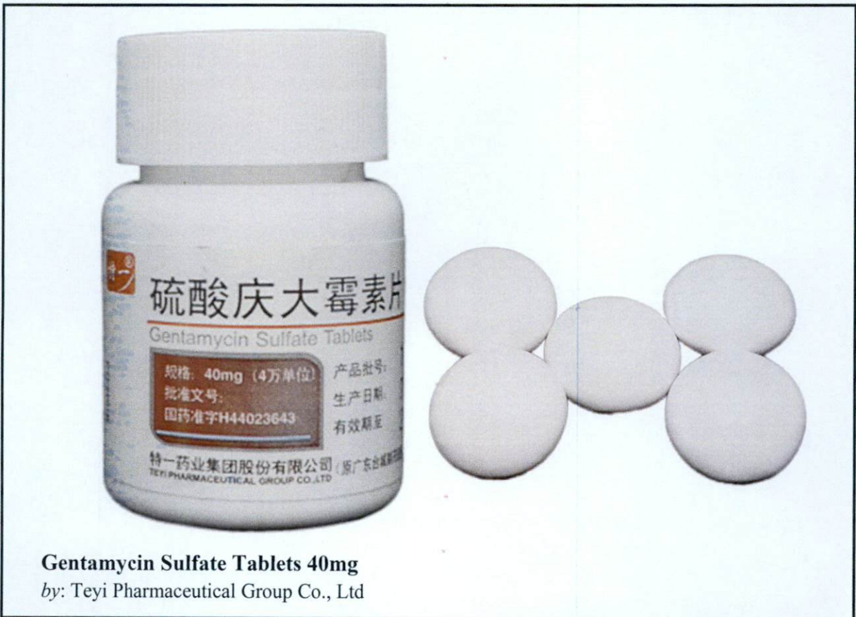
Gentamycin Sulfate Tablets 40mg by: Teyi Pharmaceutical Group Co., Ltd