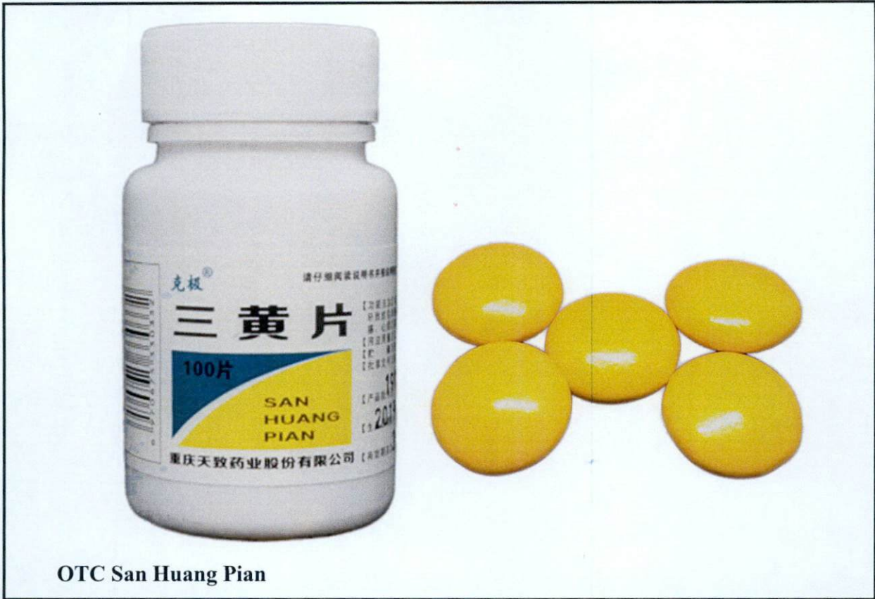
OTC San Huang Pian