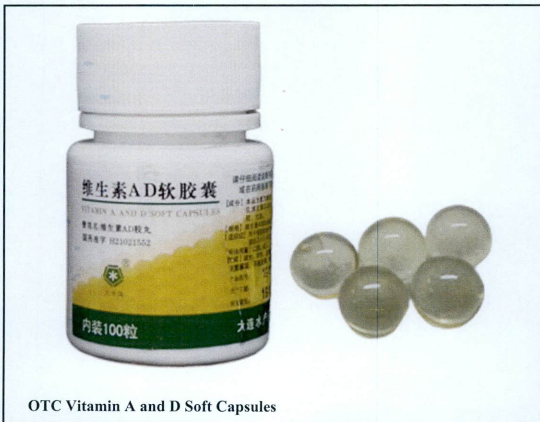
OTC Vitamin A and D Soft Capsules

Pinapayuhan ng Food and Drug Administration (FDA) ang publiko laban sa pagbili at paggamit ng mga sumusunod na hindi rehiistradong gamot: