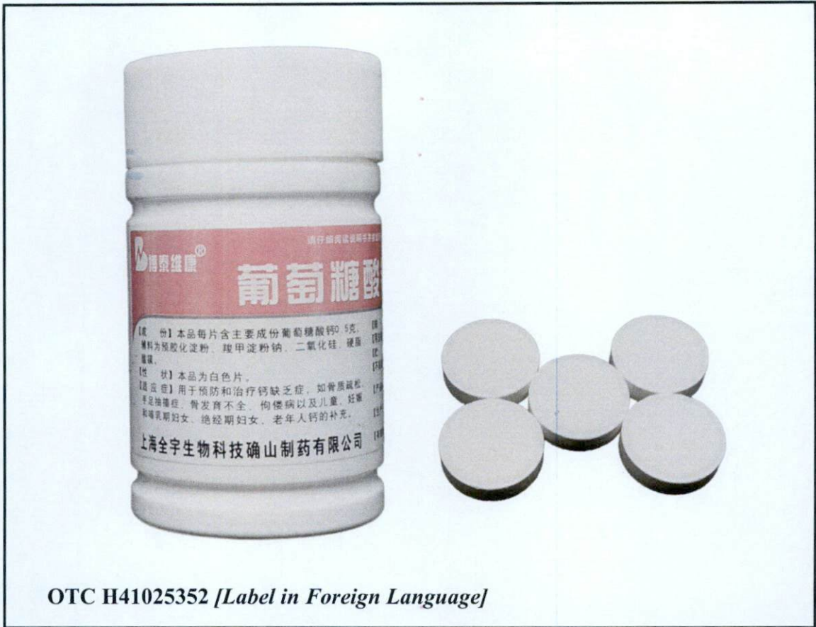
OTC H41025352 [Label in Foreign Language]