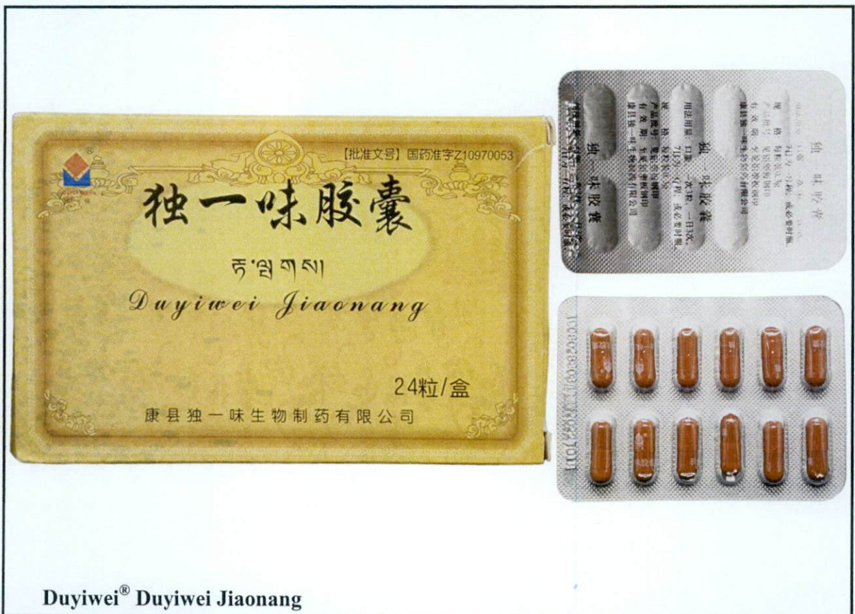
Duyiwei® Duiyiwei Jiaonang