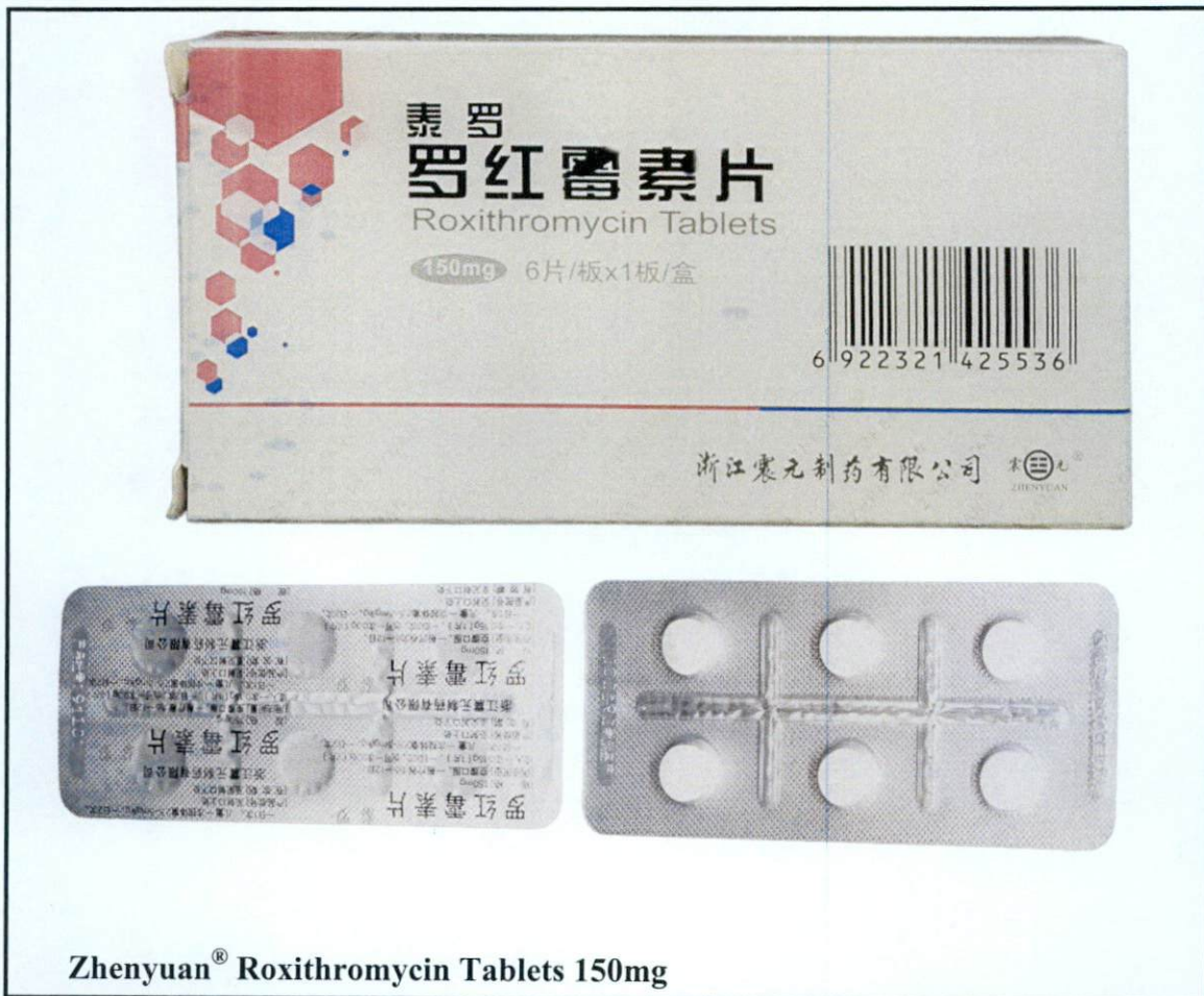
Zhenyuan® Roxithromycin Tablets 150mg

Pinapayuhan ng Food and Drug Administration (FDA) ang publiko laban sa pagbili at paggamit ng mga sumusunod na hindi rehistradong gamot: