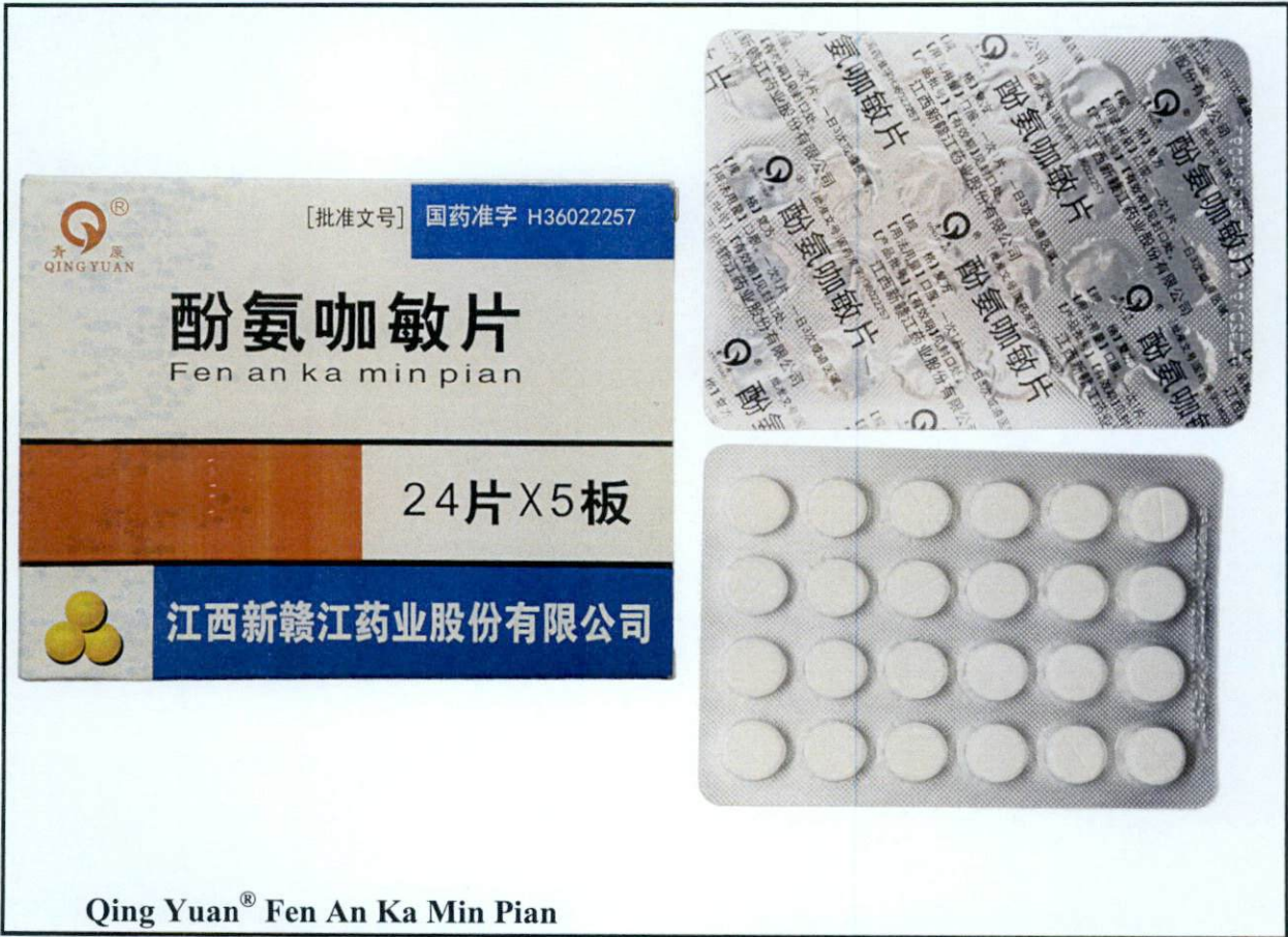
Qing Yuan® Fen An Ka Min Pian