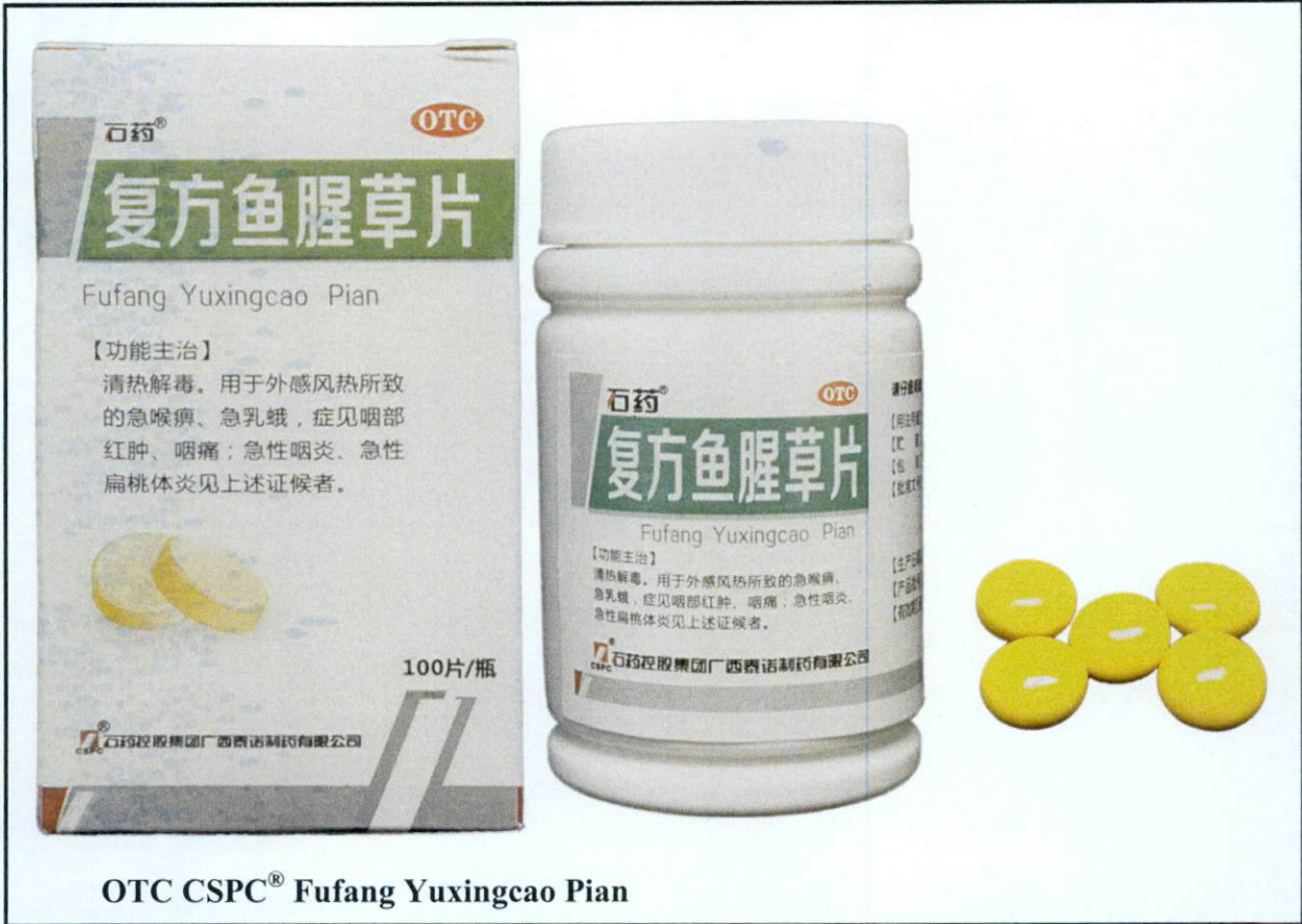
OTC CSPC® Fufang Yuxingcao Pian