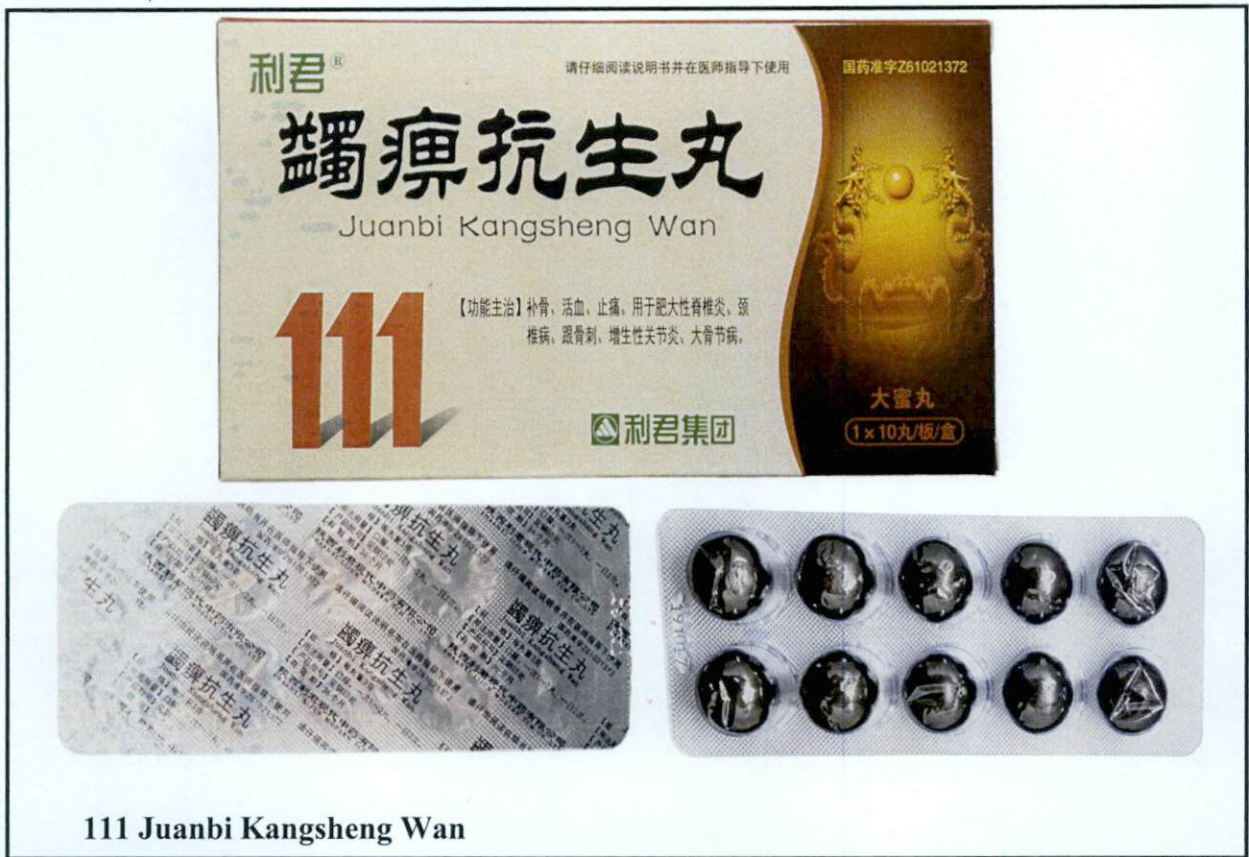
111 Juanbi Kangsheng Wan